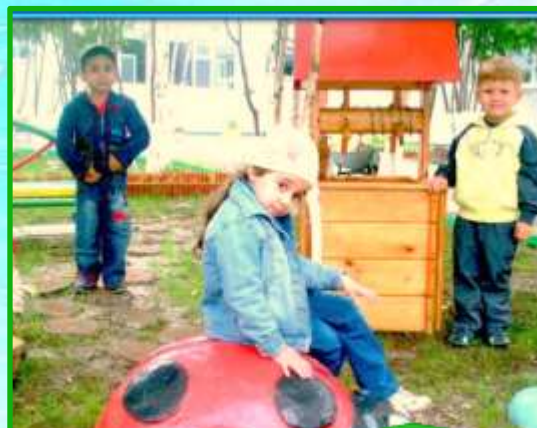
4. Световоздушные ванны.