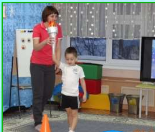
5. Активный отдых.