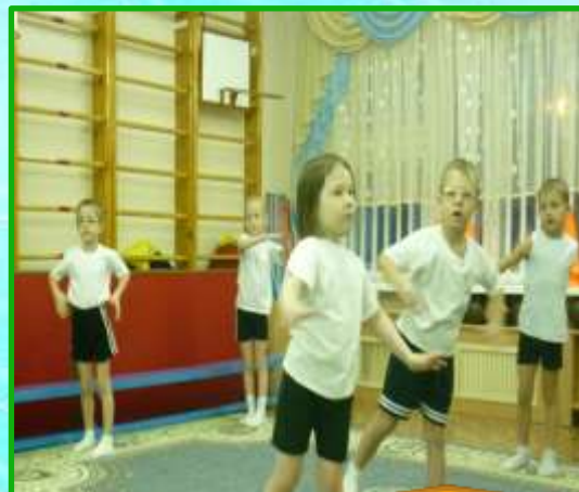
2. Физические упражнения.