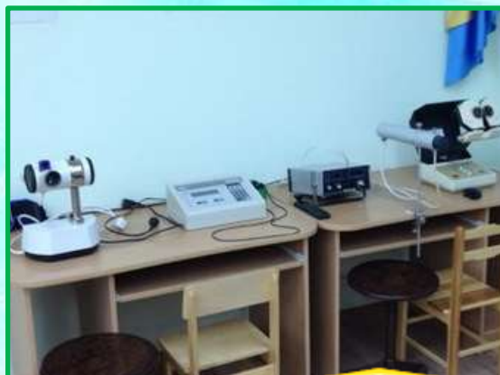
11. Лечебные мероприятия