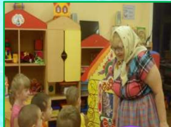
10. Аутотренинг и психогимнастика.