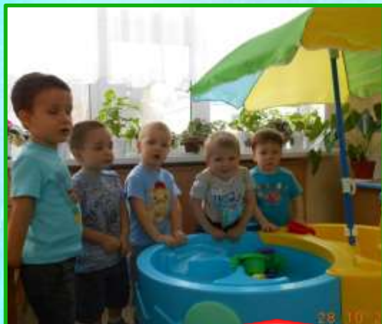
1. Обеспечение здорового ритма жизни.