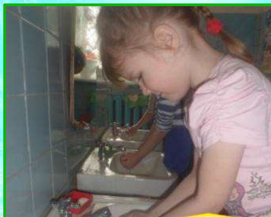
3. Гигиенические и водные процедуры