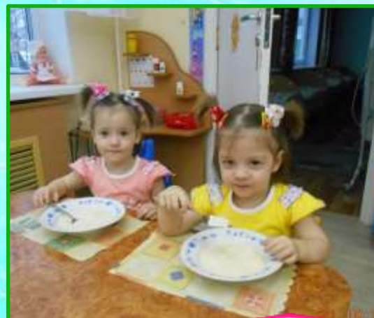
6. Фитотерапия, диетотерапия.