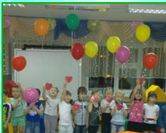
7. Светотерапия, цветотерапия.