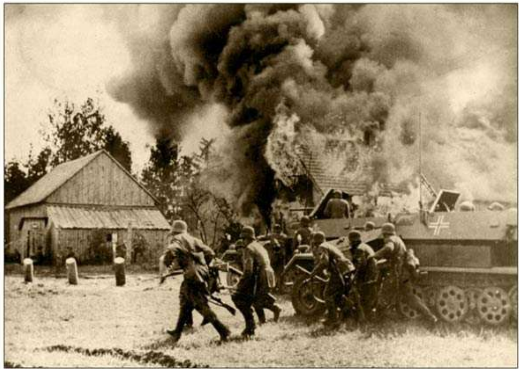
Атрад гарнікаў падпальваюць беларускую вёску, 1943 год.