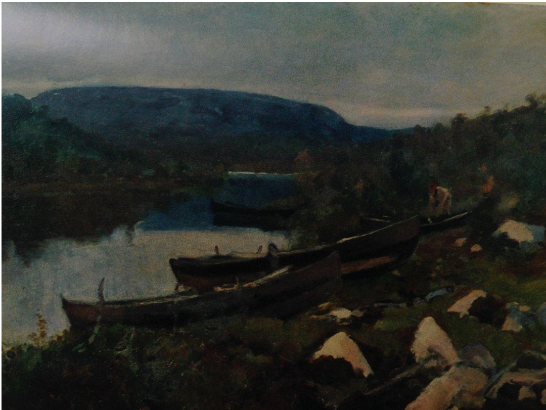
Ручей Св.Трифона в Печенге. 1894г.