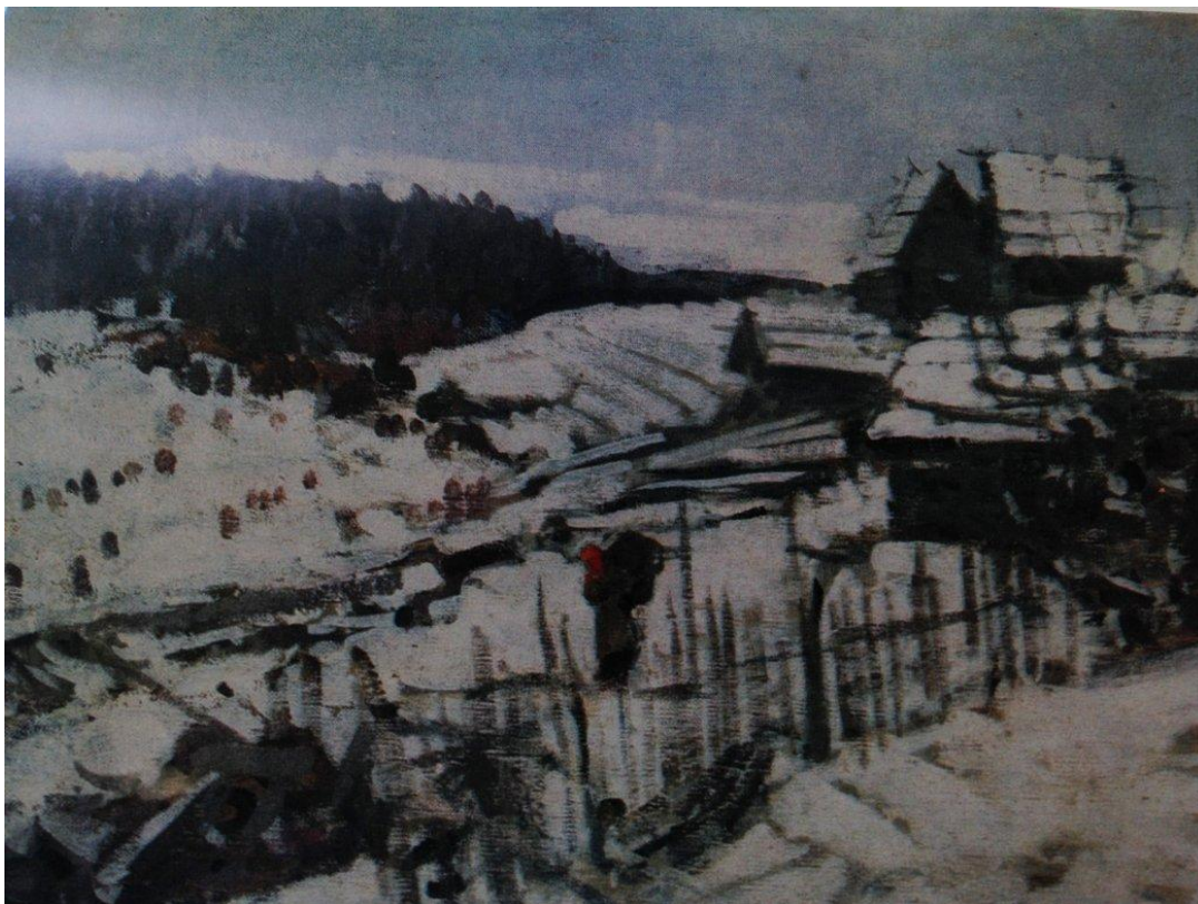
Зимний пейзаж. 1911г.