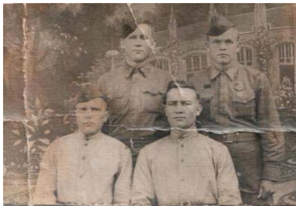
(на фото в верхнем правом углу)