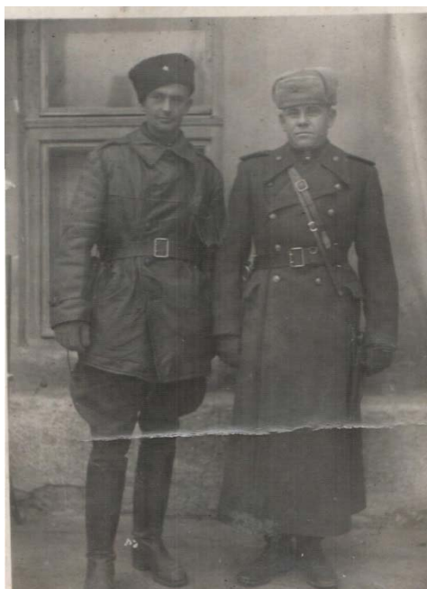
( на фото с права)