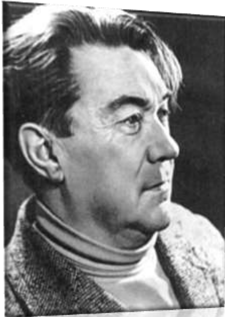
Борис Полевой (Кампов)