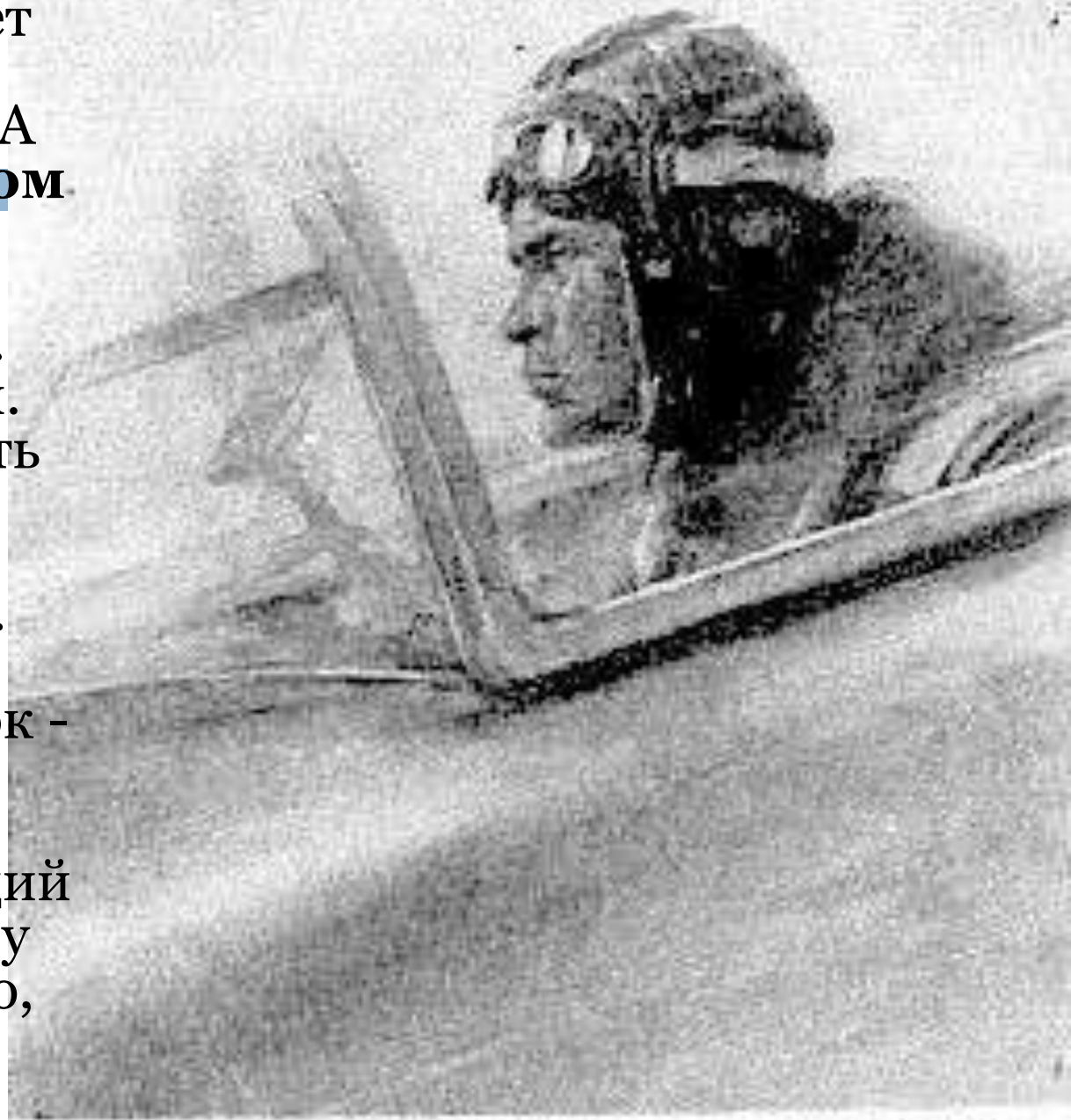
А. П. Маресьев в полете. Художник Н. Н. ЖУКОВ.