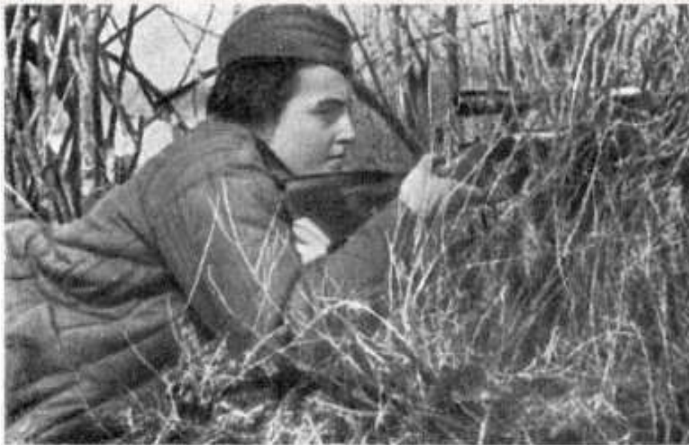
Прославленный снайпер, Герой Советского Союза Людмила Павличенко на огневой позиции.

А на фронте, то разгораясь, то затухая, шли упорные бои. Если в первую оборону неприятелю не давали покоя вылазки «охотников», то во вторую — снайперы. Имена лучших из них — Людмилы Павличенко , киевской студентки, ставшей легендарным снайпером.