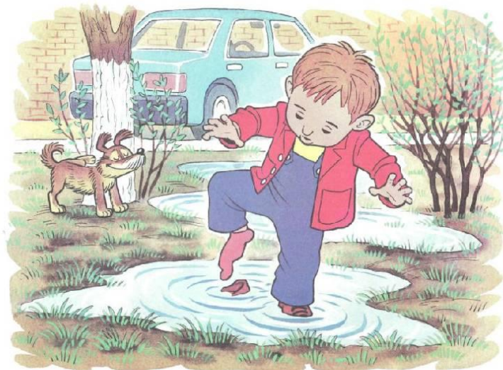
Рис. Б. К. Занягино 10. Составление рассказа по серии сюжетных картинок «Как солнышко ботинок нашло».

Попросите ребенка рассмотреть картинку и рассказать, что на ней нарисовано. Не нужно задавать наводящих вопросов. Он должен самостоятельно попробовать свои силы в этом нелегком деле. Было бы хорошо записать рассказ малыша дословно. Это поможет позже проанализировать сочиненную ребенком историю.