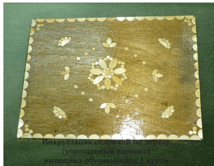
Инкрустация соломкой по дереву (упрощенный вариант) выполнил обучающийся 1 курса