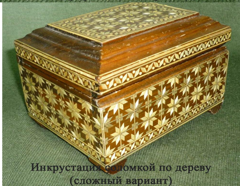
Инкрустация соломкой по дереву (сложный вариант)