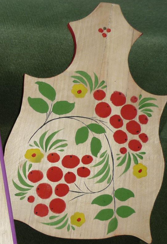
Графическая роспись по дереву