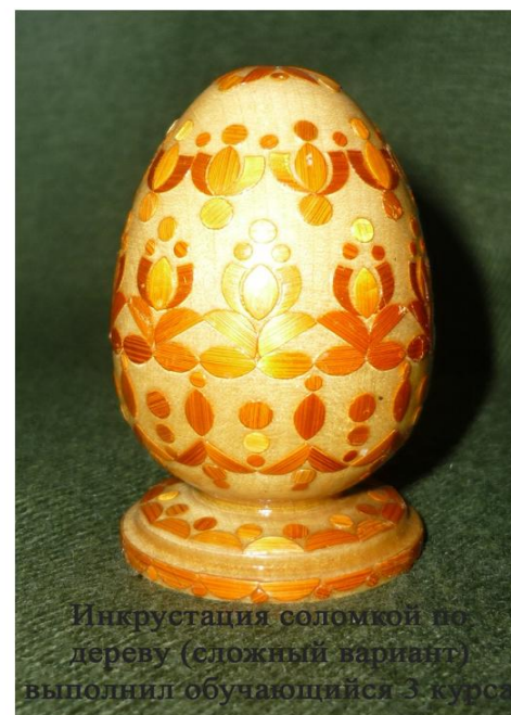
Инкрустация соломкой по дереву (сложный вариант) выполнил обучающийся 3 курса