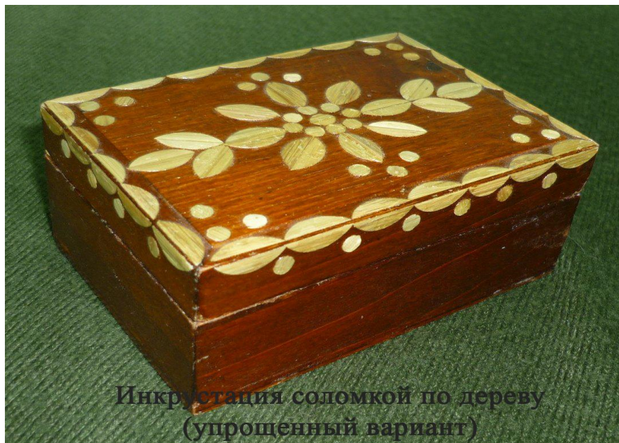
Инкрустация соломкой по дереву (упрощенный вариант)