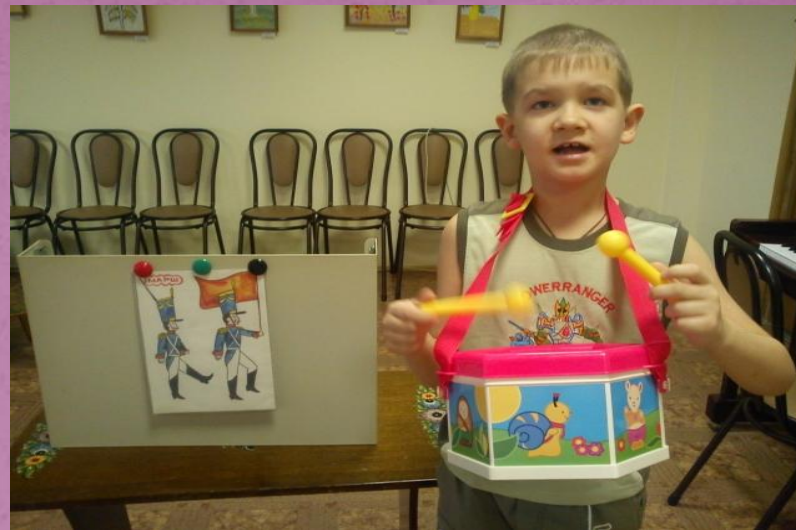
Игра «СОЛДАТЫ» - на развитие ритмического слуха.