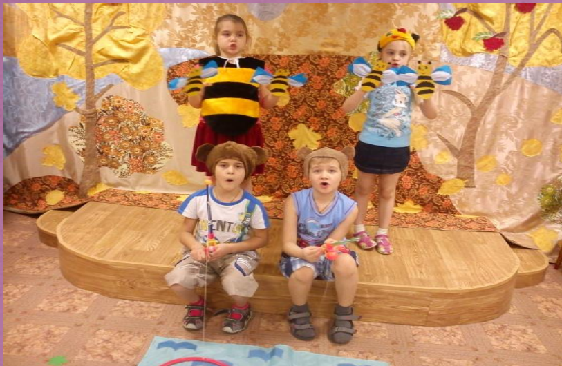
Игровое распевание «МЕДВЕЖОНОК И ПЧЕЛА» - на артистические способности.