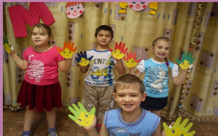
Игра «ВЕСЁЛЫЕ ЛАДОШКИ» - на передачу ритмического рисунка.