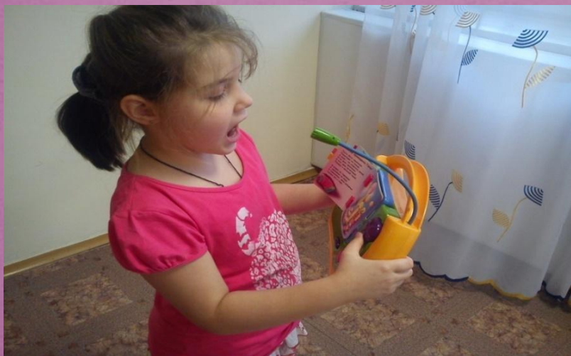
Упражнение «ВЫКЛЮЧЕННЫЙ МИКРОФОН» - на развитие звуковысотного слуха