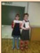
Мастера головных уборов