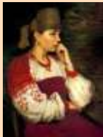
Девушка из народа