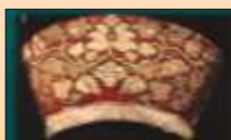
Кокешник (Север Руси)