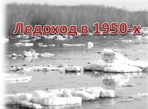
Ледоход в 1950-х

Еще одним историческим событием, канувшим в лету, можно назвать весеннее половодье в городе Грязи. До строительства Матырского водохранилища, при весеннем таянии снега уровень Матыры резко поднимался. Река разливалась практически до нашего детского сада, расположенного на улице Правды, называемой «Грязинским Арбатом». Сейчас такого конечно уже не увидеть. Вот так человек, построив дамбу, изменил не только силуэт реки, но и ее характеристики.