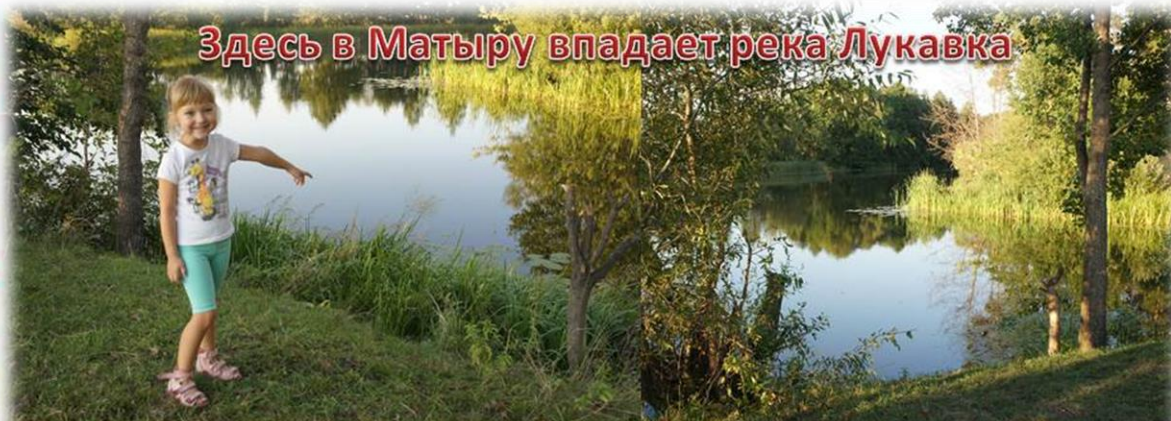
Здесь в Матыру впадает река Лукавка

Далее наш путь продолжился уже по Грязинскому району. Мы посетили село Лукавка, где одноименная река впадает в Матыру. Ее имя происходит от слова «лука», означающего пойменный луг в излучине. Длина реки составляет всего 30 км. Мне там тоже очень понравилось. Папа показал мне места, где он путешествовал в детстве со своими родителями. Рассказал, как тающий весной снег пополняет Лукавку, в некотором роде, давая ей жизнь. И я даже видела высохшие каналы в земле, оставшиеся от весенних потоков воды, стекающей в результате таяния снега. Так я узнала, как снег «питает» реки.