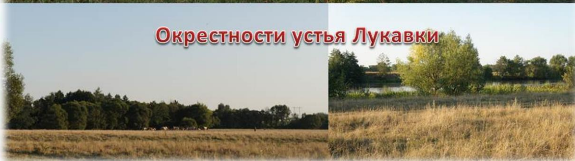
Окрестности устья Лукавки

А немного выше по течению, в селе Петровка Грязинского района, расположена туристическая база отдыха, где я увидела, что человек вполне может отдыхать, не причиняя вреда природе. Все постройки базы, «вжились» в лес. В этом месте Матыра уже достаточно широкая и глубокая. Здесь водится много рыбы, и я даже видела моторную лодку, на которой плыли рыбаки. А вслед за ними плыла и моя подружка Капелька, сопровождаемая стрекозами и бабочками, которых, к слову сказать, на берегу Матыры достаточно много.