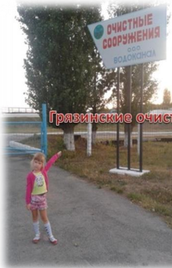
Грязинские очистные сооружения

Дальше мы переместились к Грязинским очистным сооружениям, которые служат для удаления загрязнений из канализационных вод. На территорию нас, конечно, не пустили, но папа рассказал, что всё, что мы сливаем в канализацию, попадает сюда, на очистные сооружения. Здесь, сточная вода сначала проходит механическую очистку. Потом эту воду чистят бактерии, «поедая» все вредные вещества. Узнав это, я сильно удивилась, т.к. всегда думала, что бактерии только наносят вред человеку, а оказалось, что бывают и полезные бактерии. После вода проходит физико-химический и дезинфекционный этапы, которые, если честно, я совсем не поняла. Но в результате очищенная вода попадает в Байгору, а оттуда в Матыру.