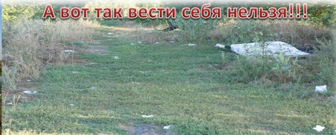
А вот так вести себя нельзя!!!