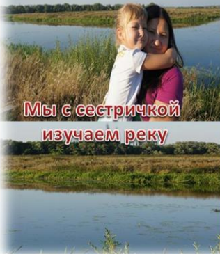
Мы с сестричкой изучаем реку