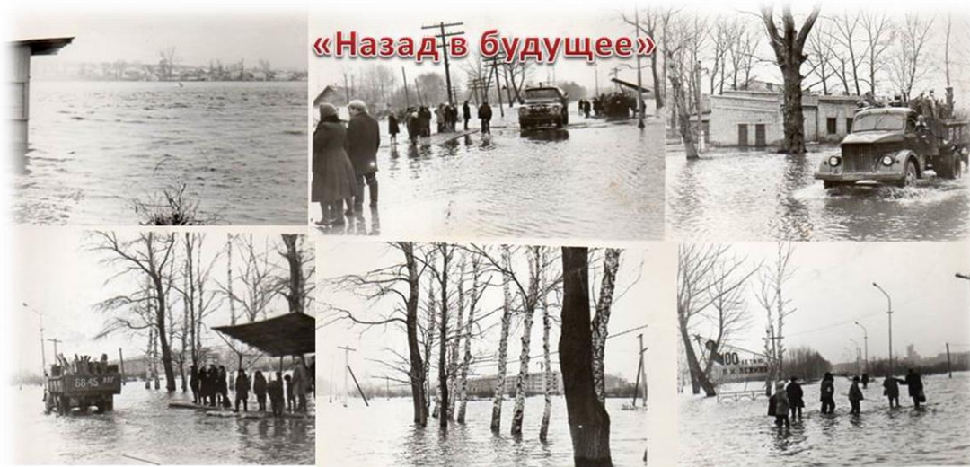
Вот так Матыра разливалась до строительства водохранилища

Богата река и рыбой, и раками. Мы с родителями несколько раз ездили на рыбалку вверх по течению Матыры. В район с. Петровка Грязинского района, о котором я рассказывала раньше, даже поймали несколько рыбок, но я их всех отпустила обратно. Мне очень понравилась рыбалка. Теперь у меня есть своя, небольшая удочка. А дедушка мне рассказывал, что когда он был маленьким, то они с друзьями ловили очень много раков в Матыре, а вода была настолько чистая, что они даже пили из реки.