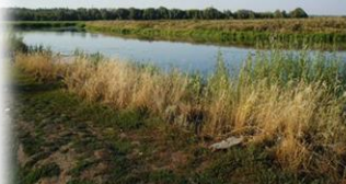
А здесь раньше был паром