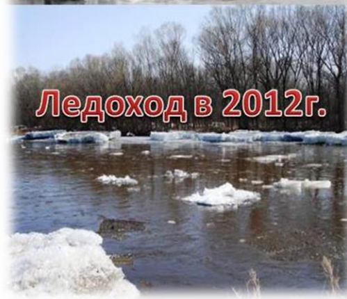
Ледоход в 2012г.