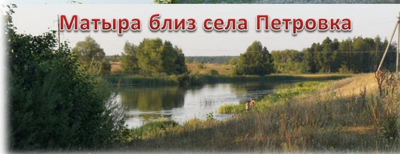
Матыра близ села Петровка