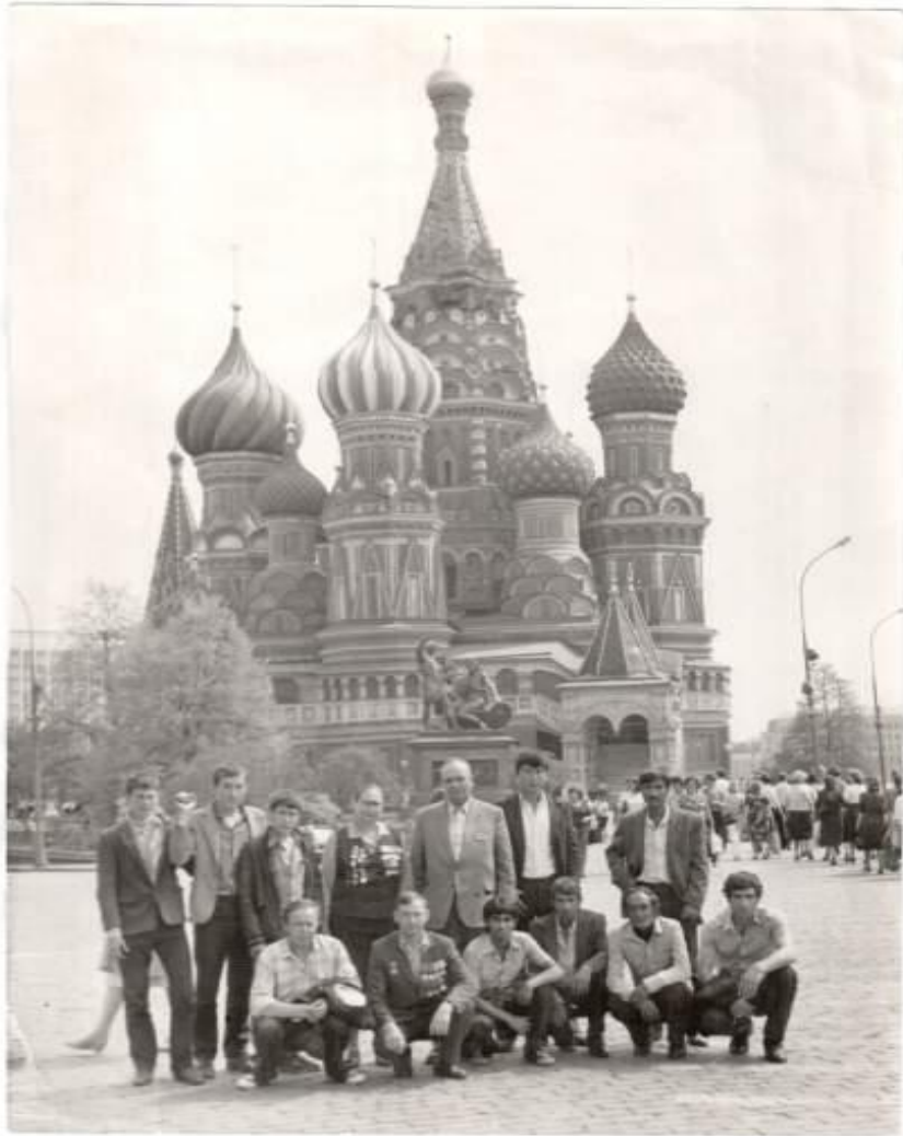
Әсгать абый сугышчан дуслары, аларның туганнары белән очрашуда, 1999 ел.