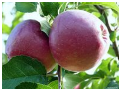
Яблочки садовые- сладкие