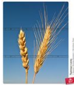
Пшеница и рожь