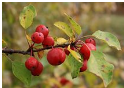
Яблочки лесные- дикие – кислые, мелкие