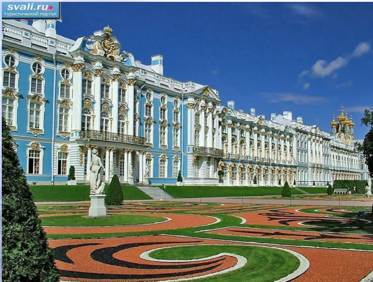
Екатерининский Дворец в Пушкине