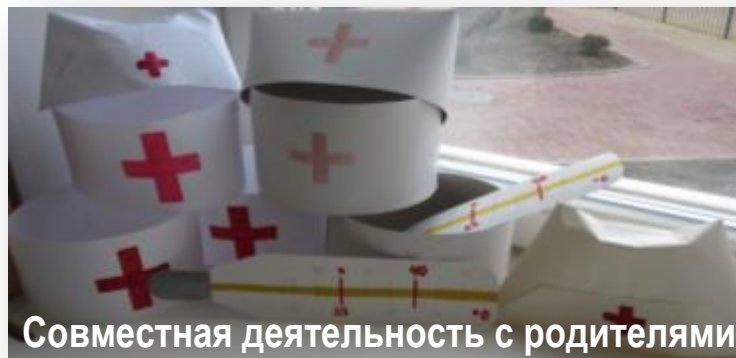
Совместная деятельность с родителями

На белой машине с красным крестом Доктор примчится к больным в каждый дом. Другие машины ей путь уступают. Скорую помощь все граждане знают!