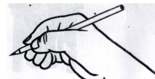
РУКА ПРАВИЛЬНО ДЕРЖИТ РУЧКУ

Ручка должна лежать на левой стороне среднего пальца. Указательный палец сверху придерживает ручку. Все три пальца слегка закруглены и не сжимают ручку сильно.