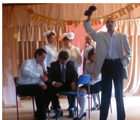
Коллектив школы представляет свою визитную карточку