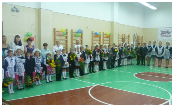
Торжественная линейка, посвящённая Празднику первого звонка