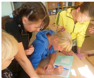
Санитарный сектор подводит итоги недели по конкурсу «Самый чистый класс»

В школе продолжает работу детское самоуправление. Активисты детской организации «Адонис» ежедневно собираются по секторам: учебный, спортивный, трудовой, пресс-центр, санитарный, творческий. Учебный сектор провел два рейда «Учебник» и «Дневник», было проверено состояние учебников и дневников учащихся 5-9 классов. Трудовой сектор организовал операцию «Забота», в рамках которой была оказана помощь ветеранам труда и пожилым людям села.