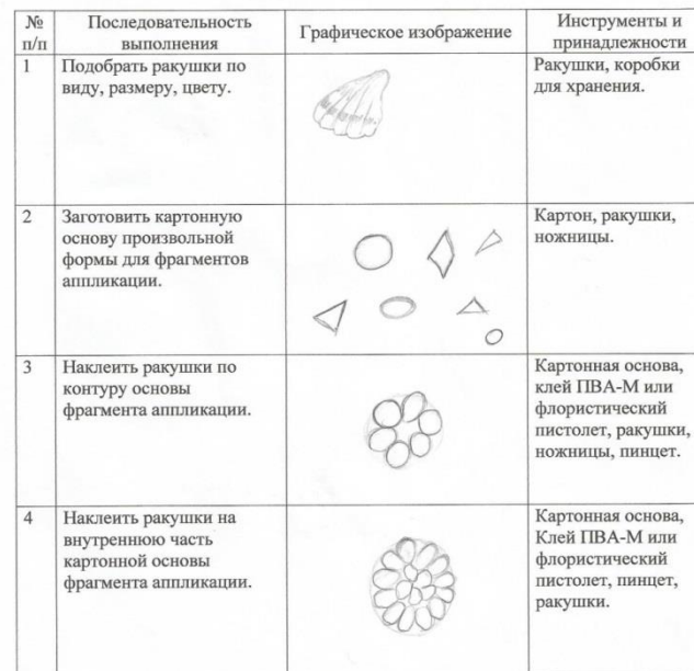
Технологическая карта «Изготовление цветов из ракушек»

Заготовленные фрагменты можно использовать для изготовления декоративных панно или составлять букеты, прикрепив к фрагментам веточку.