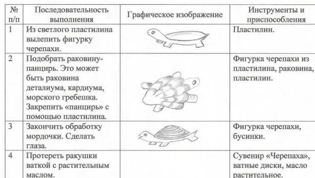
Технологическая карта «Изготовление сувенира «Черепаха»

Для изготовления подобных сувениров необходимо подбирать крупные раковины с выраженным рисунком.