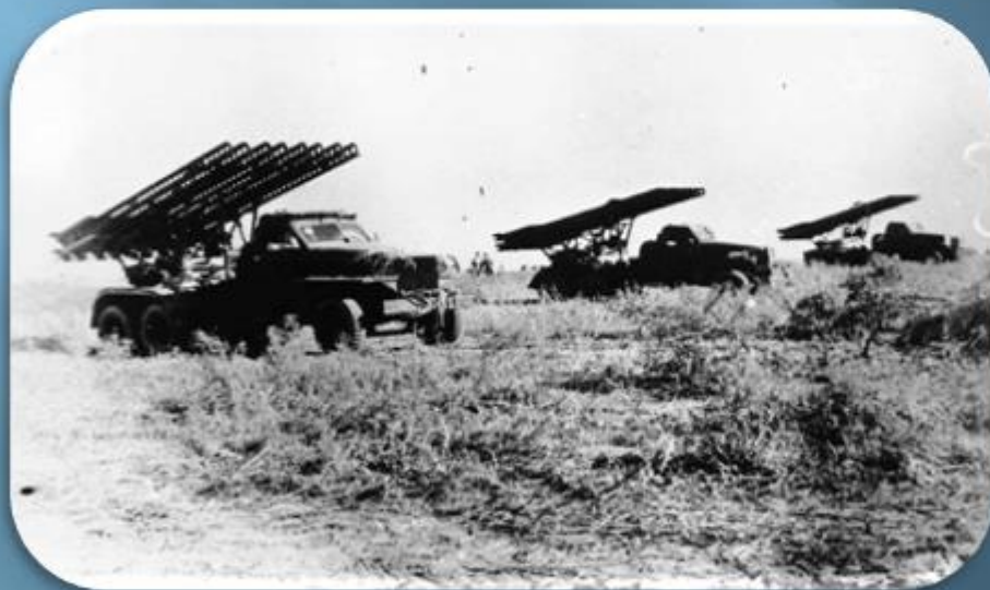
Боевые машины в ожидании атаки