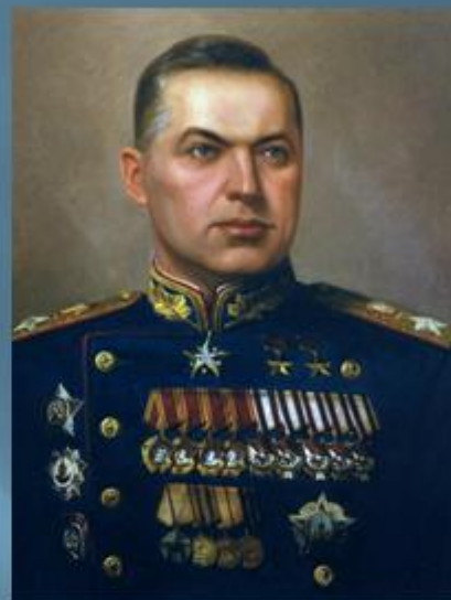
Маршал Советского Союза К. К.Рокоссовский