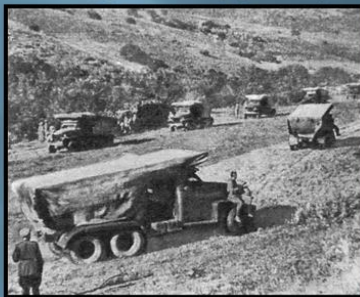
Гвардейский миномётный дивизион выводит машины на боевую позицию

На фронте в июне 1941 года был назначен водителем боевой машины 259-го гвардейского миномётного дивизиона ( 43-й гвардейский кавалерийский корпус, 1-й Белорусский фронт ).