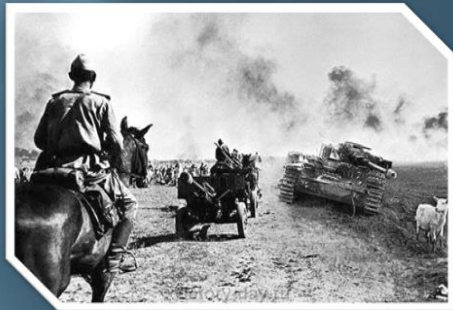
Русская армия выходит на боевые позиции