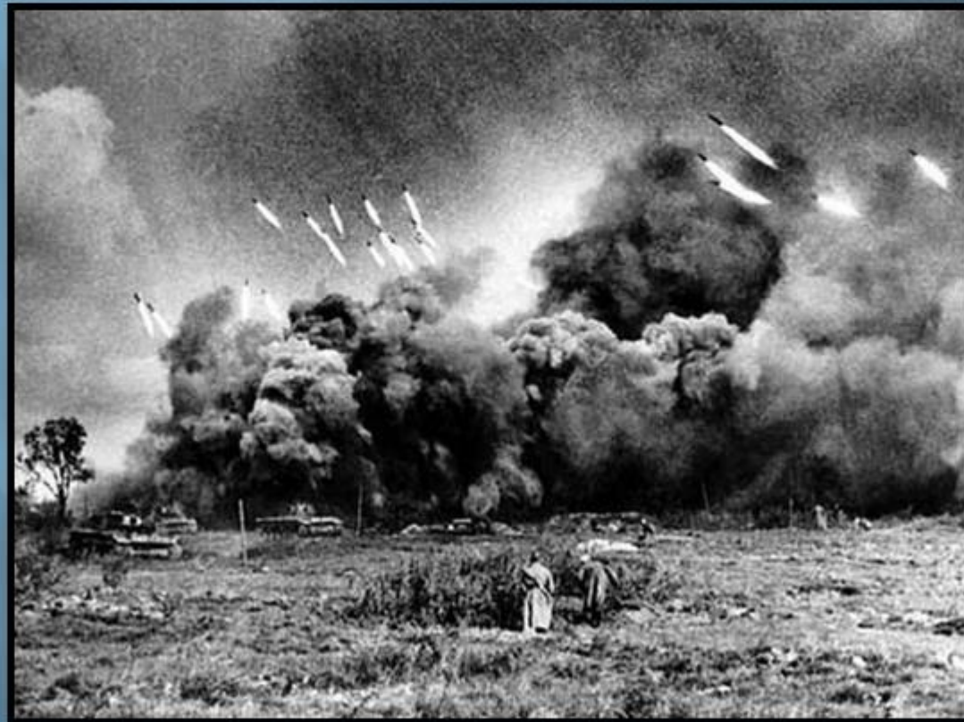
Залп Катюш перед атакой танков