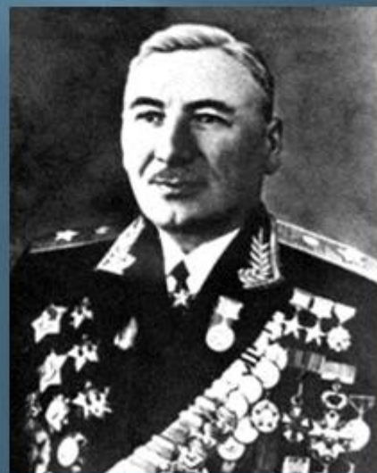
Дважды Герой Советского Союза, генерал- армии И.А.Плиев