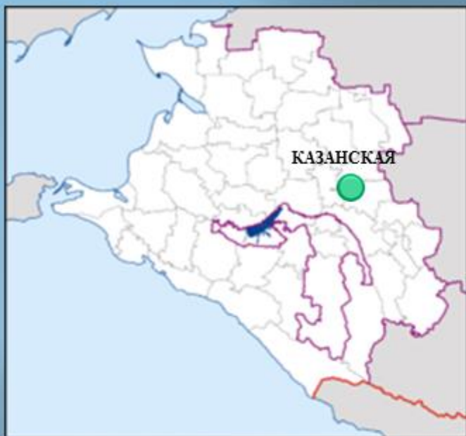
Краснодарский край, Кавказский район, станция Казанская