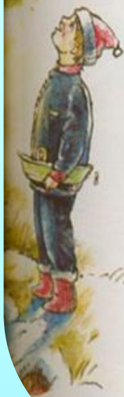
Рис. А. СОКОЛОВА

Миша выговорит слово, А второго не видать, Но товарищи готовы, Если надо, подождать.