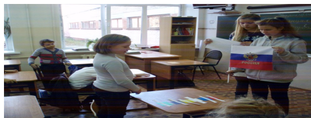
3 станция - “Символическая”