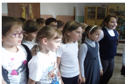
2 станция- “Музыкальная”