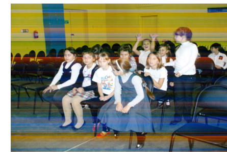
6 станция – заключительная (нарисовать герб нашего класса и придумать девиз)