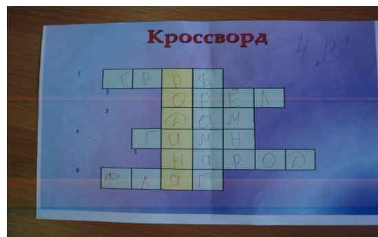
4 станция – “Кроссвордная”