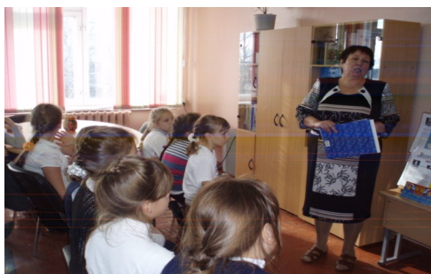
1 станция – “Библиотечная”