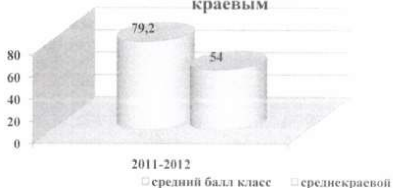
Средний балл класса по истории в сравнении с краевым