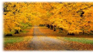
2. Золотая осень