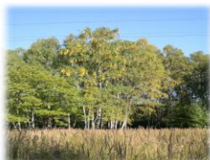
1. Начало осени