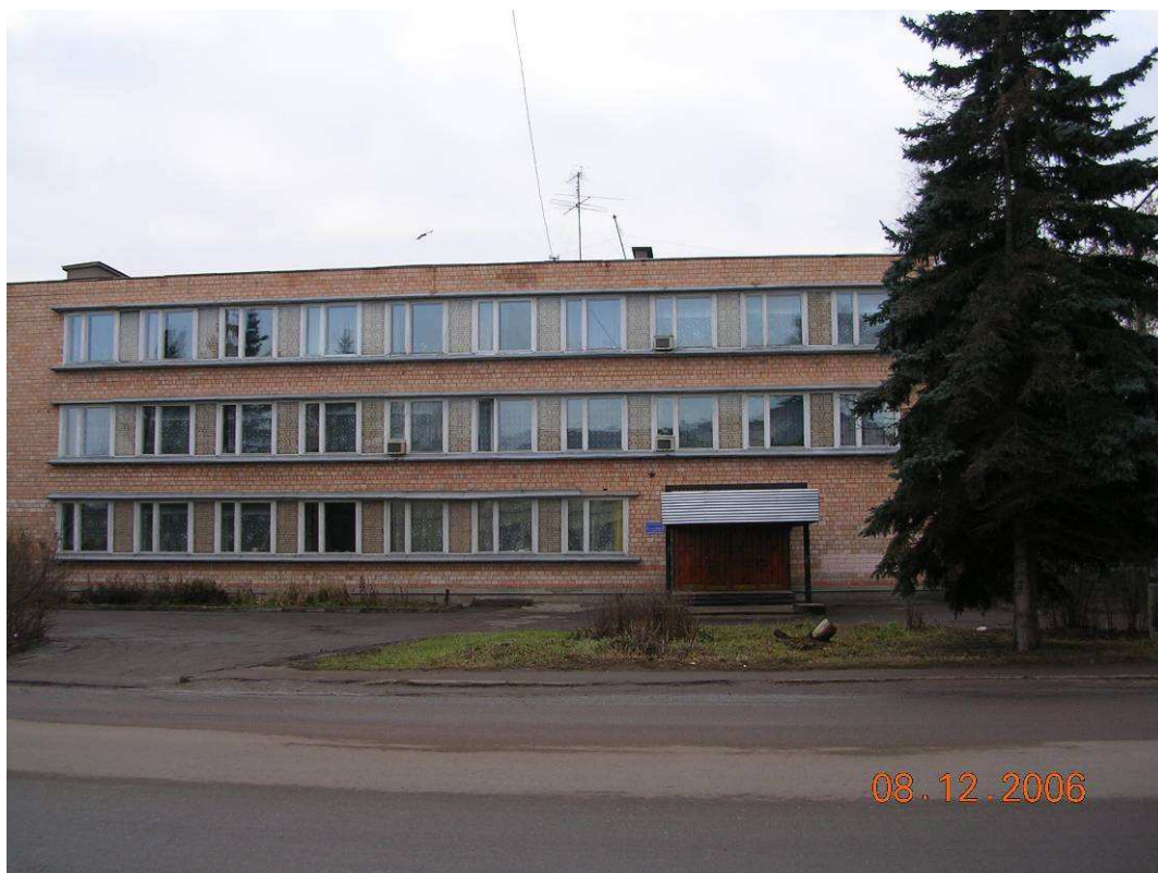
Фото №10: Музыкальная школа

- Это здание я думаю, что тоже многим из вас знакомо. Кто может мне рассказать, что это за здание? (Ответы детей.)