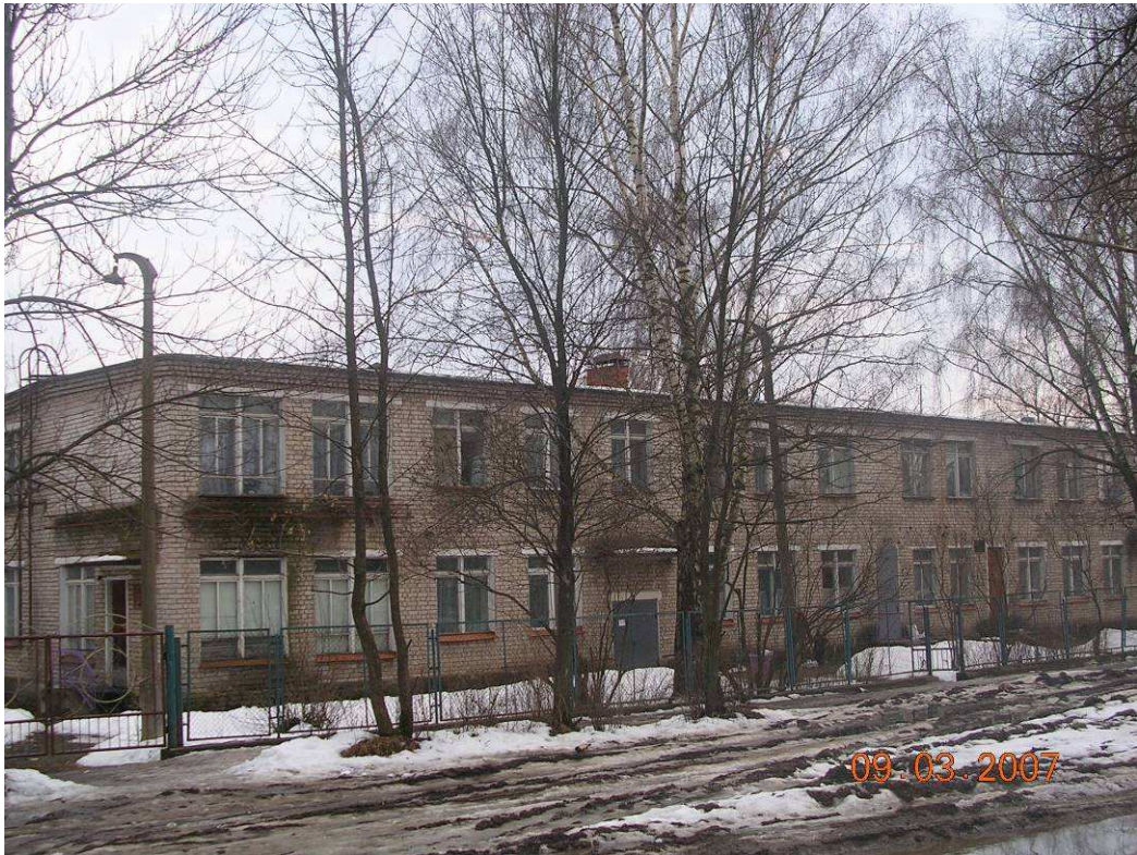
Фото № 1: Д/сад