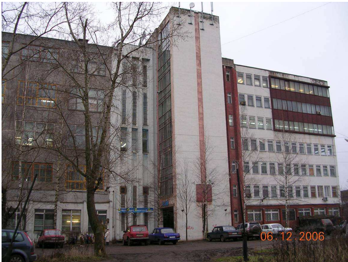
Фото №5: Трикотажная фабрика

- Это одна из многочисленных фабрик нашего города. Как она называется? А чья мама работает на трикотажной фабрике? ( Ответы детей. )