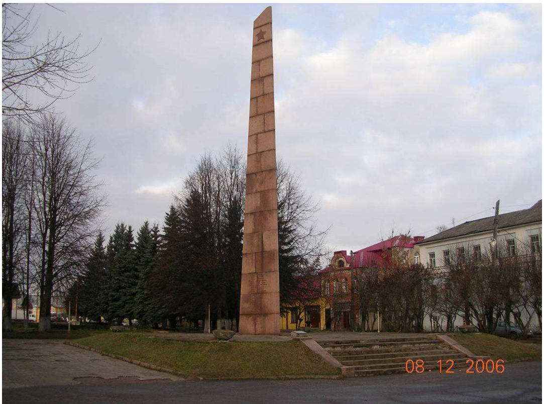
Фото №9: Обелиск славы

- Это памятник авиаконструктору Туполеву, мы гордимся, что он наш земляк. Им было создано более 100 типов самолетов, гражданских и военных.