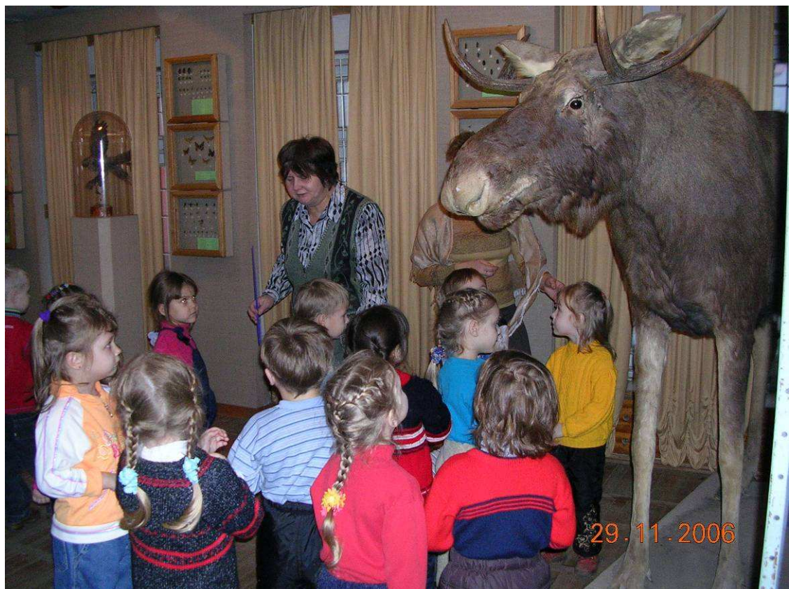
Фото №7: Музей

- Река узкая, не судоходная, мелководная.