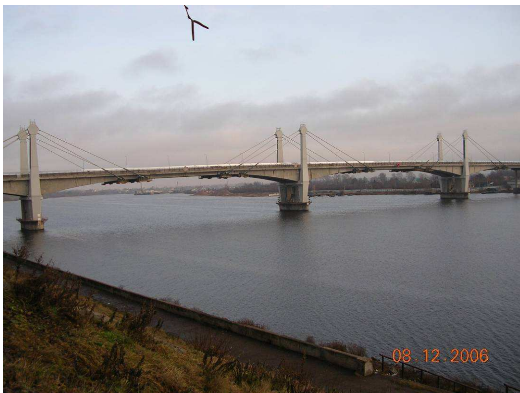
Фото № 4 Мост