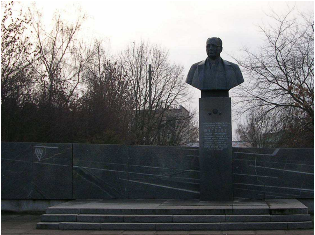
Фото №8: Памятник Туполеву

- Это памятник авиаконструктору Туполеву, мы гордимся, что он наш земляк. Им было создано более 100 типов самолетов, гражданских и военных.