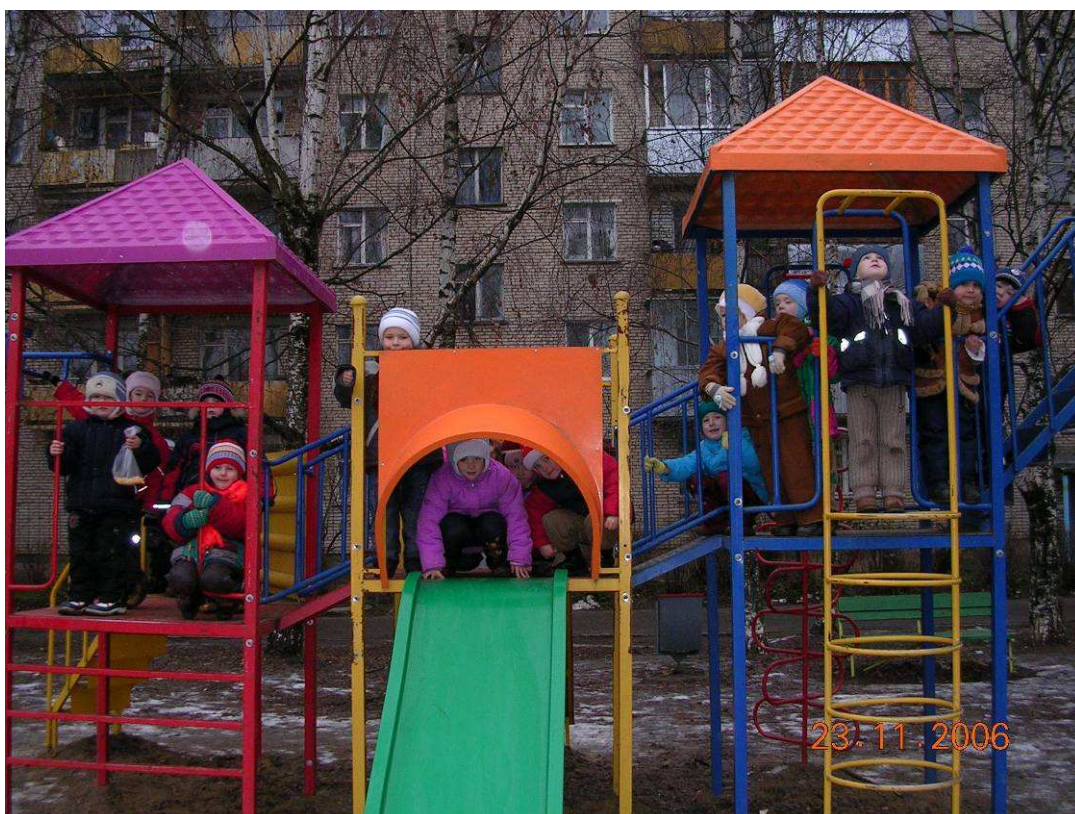
Фото №11: Детская площадка

- Это здание я думаю, что тоже многим из вас знакомо. Кто может мне рассказать, что это за здание? (Ответы детей.)