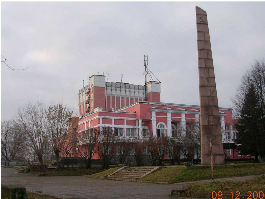
Фото №2: Драмтеатр