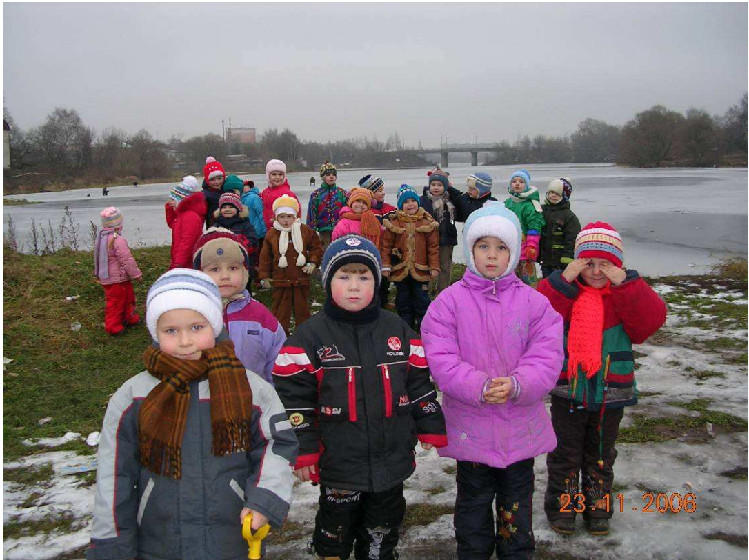
Фото №6:р. Кимрка

- Здесь вы узнали себя и друг друга. И вы, конечно же, узнали то место, где мы часто с вами бываем. А вы когда-нибудь видели, чтобы по этой реке проплывали теплоходы ( Ответы детей. )