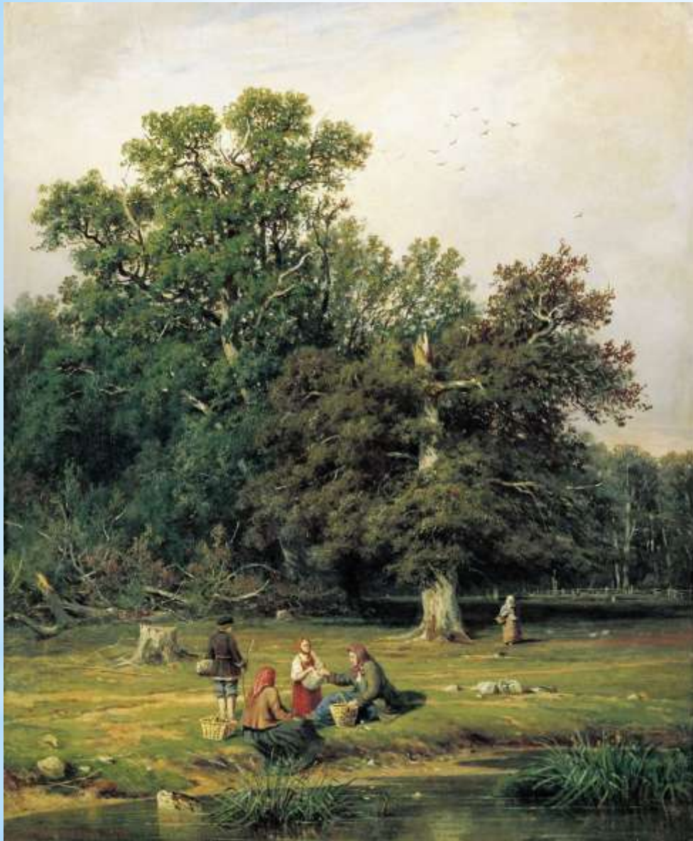
* Шишкин И.И., За грибами