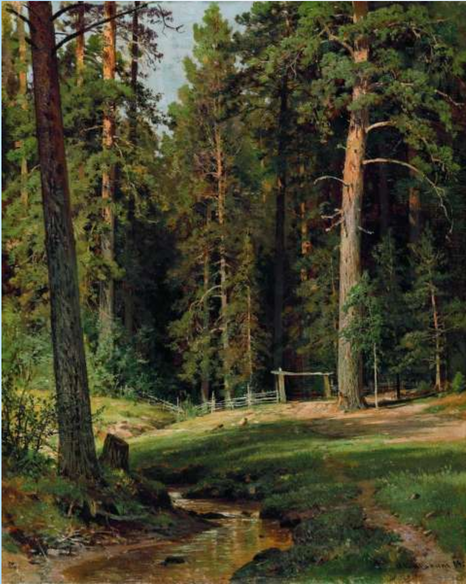
* Шишкин И.И., Опушка леса