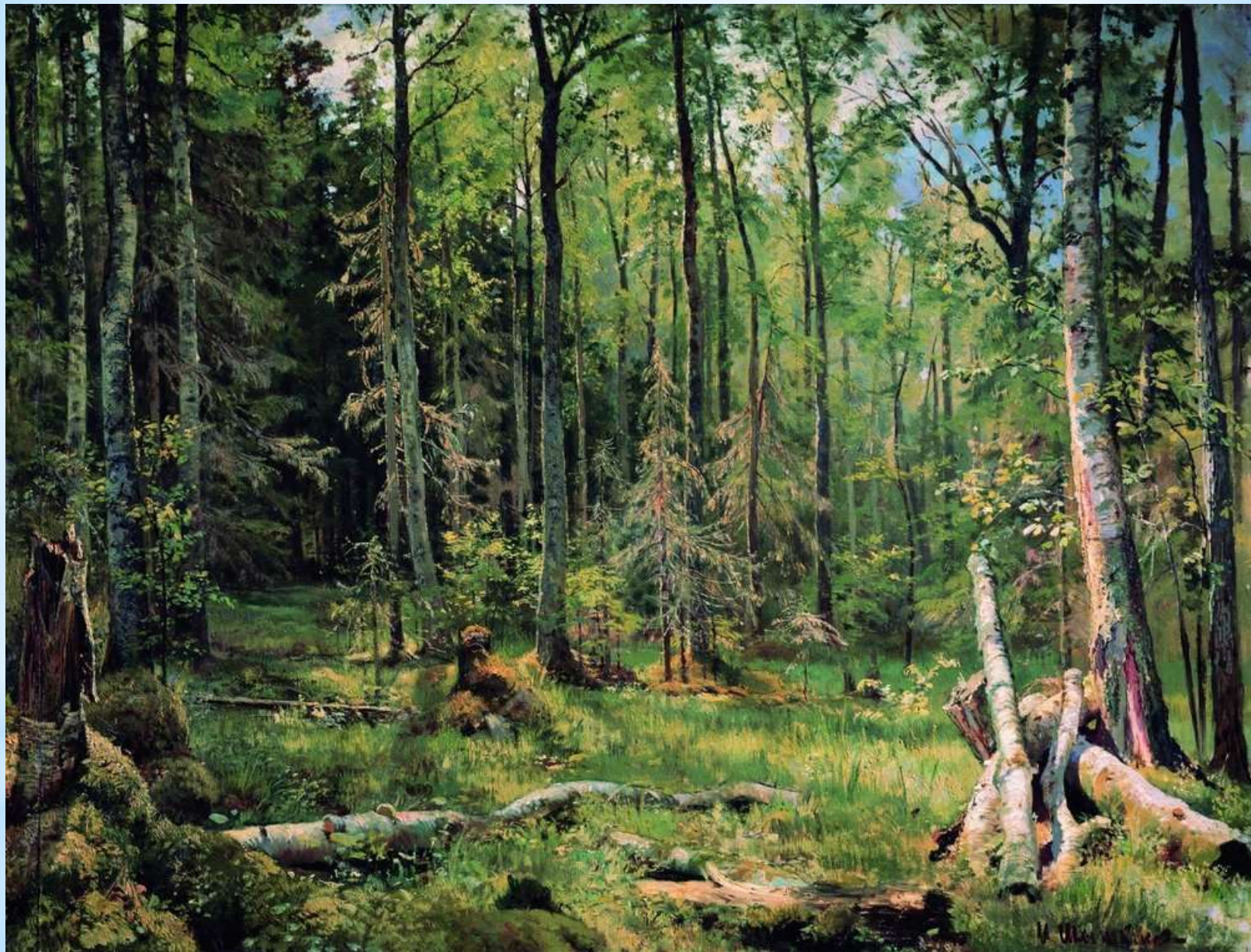
* Шишкин И.И. Смешанный лѣс (Шмецк близ Нарвы)