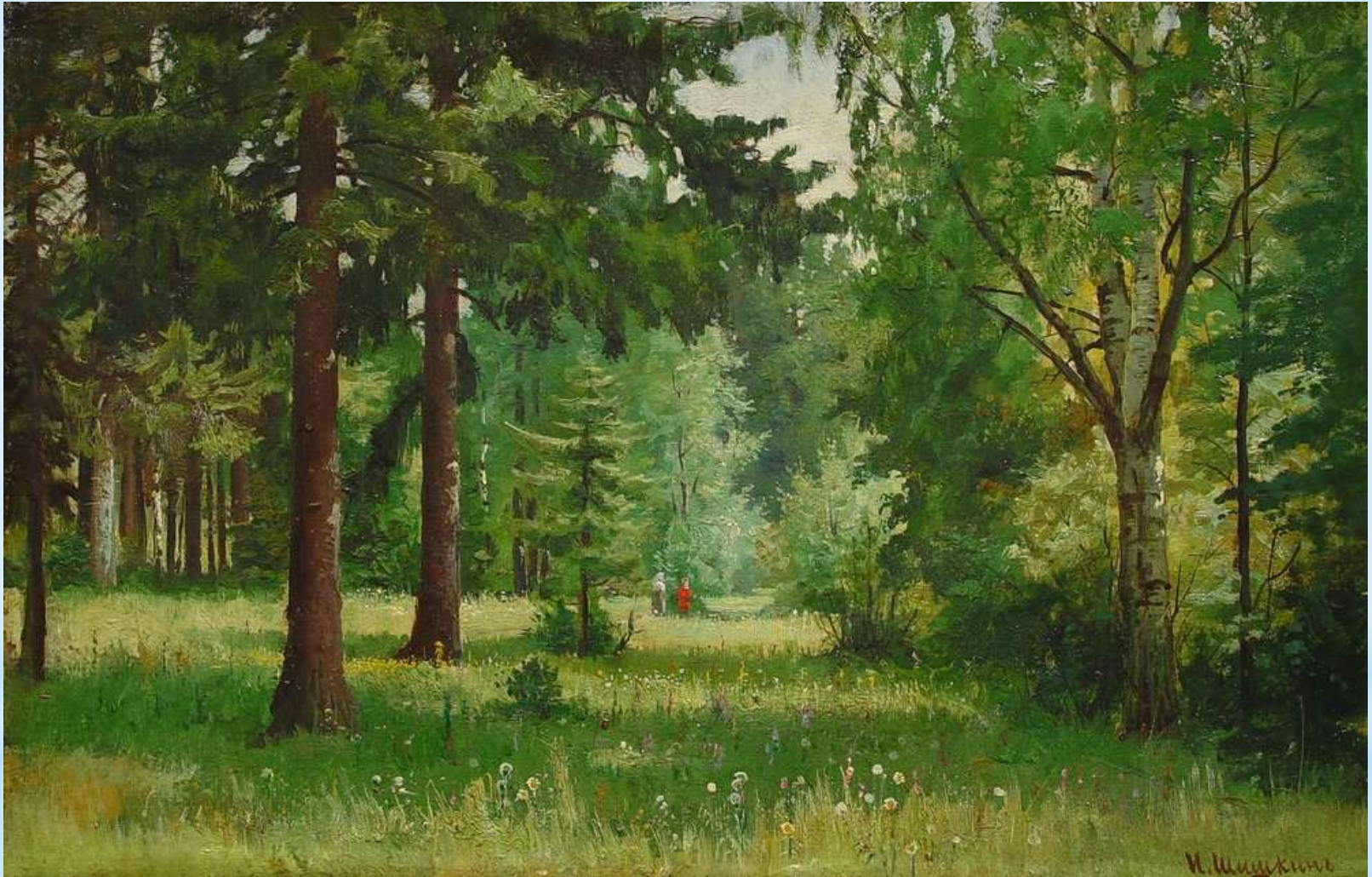
2 * Шишкин И.И., Дети в лесу