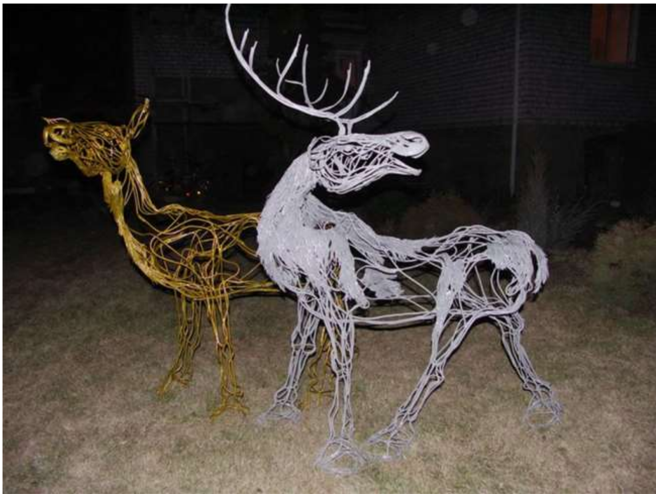
изделия из проволоки, садово-парковая скульптура,