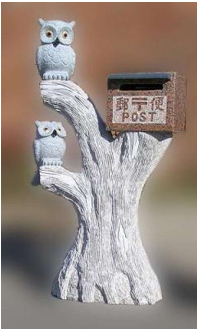
Садово-парковая скульптура из натурального гранита.