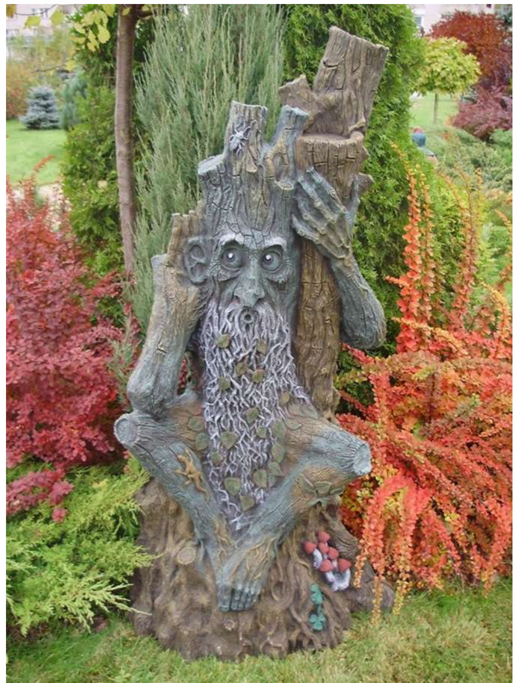
Садовая скульптура - садовая фигура Леший.