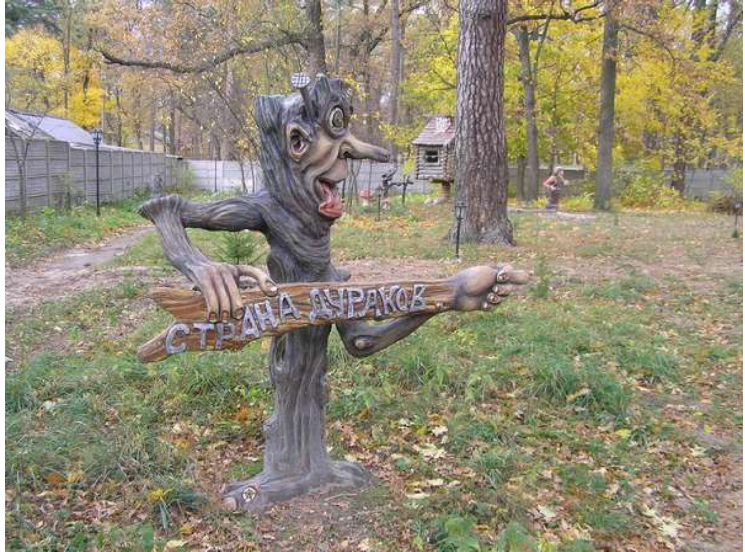
САДОВО-ПАРКОВАЯ СКУЛЬПТУРА. ВИБРОЛИТЬЁ.