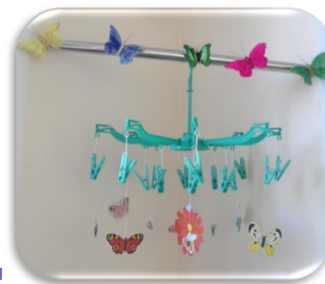
Зона развития речевого дыхания