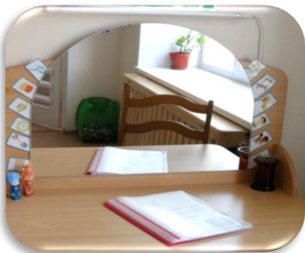
Зона коррекции произношения