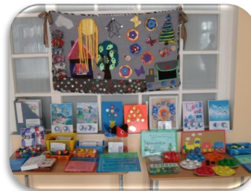
Зона развития мелкой моторики