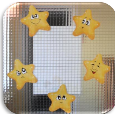
Зона эмоционального контакта