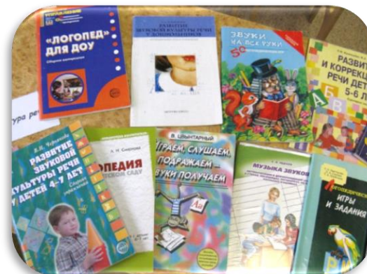
Зона методического сопровождения