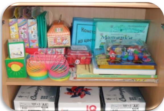
Зона игрового сопровождения