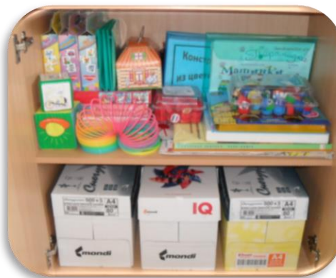
Зона дидактического сопровождения