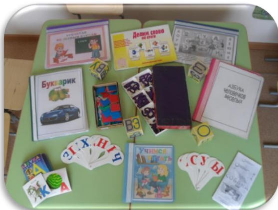
Зона звуко-буквенного анализа ( обучение грамоте)