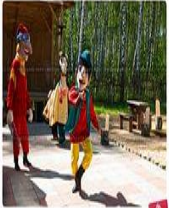
Видеоролик анимационного театра «Сказки» в «Космическом центре»