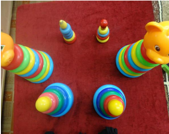
рис. № 8

Работу по восприятию цвета проводили с учетом индивидуальных особенностей малышей. ребятам хорошо усвоившим цвет, задания в дидактических играх усложняли.