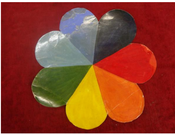
рис. № 7