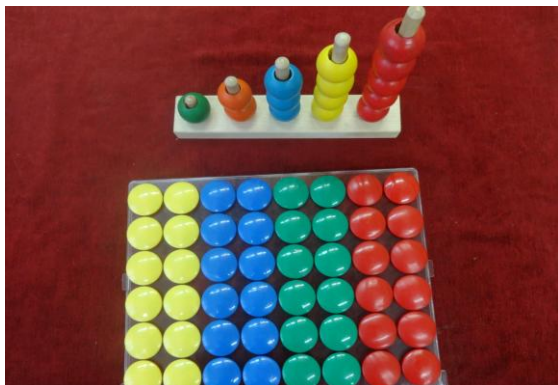
рис. № 4

обменивались предметами, сравнивали их, делали умозаключение (например «Такой же шарик», «Грибочки одинаковые» (рис. № 2), «Варежки разные»).