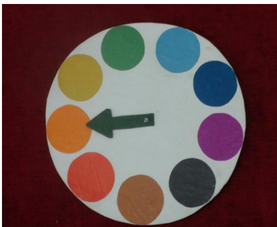
рис. № 3

логическое мышление. Предлагали дидактические игры: «Грибочки, по местам» (рис. №1), «Не ошибись», «Подбери правильно»! Дидактический материал вызывал у детей большой интерес, желание действовать. Малыши