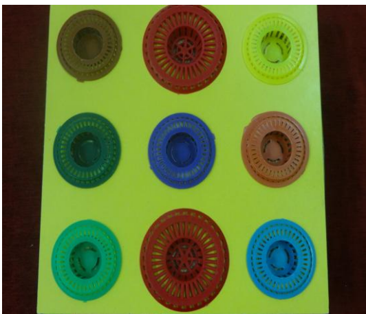
рис. № 2

Знакомство детей с цветом, как признаком конкретного предмета, происходит сравнительно легко. Но точное название цвета, использование его как опознавательного признака, требует особого, целенаправленного обучения.