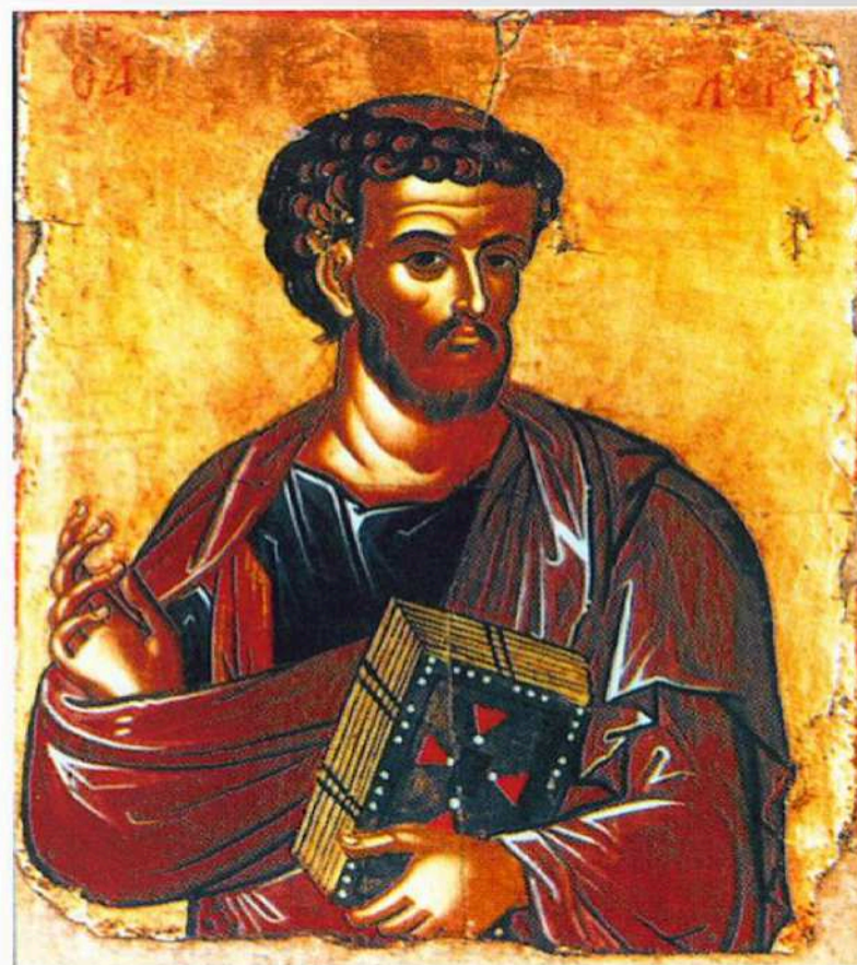
Евангелист Лука. Икона XIV в.