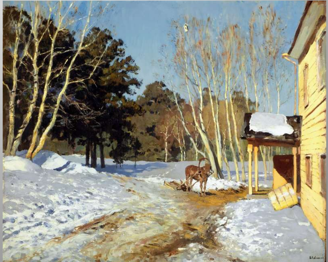
И. И. Левитан «Март»

- По картинам расскажите о каждом месяце, характерных особенностях и отличиях каждого месяца.