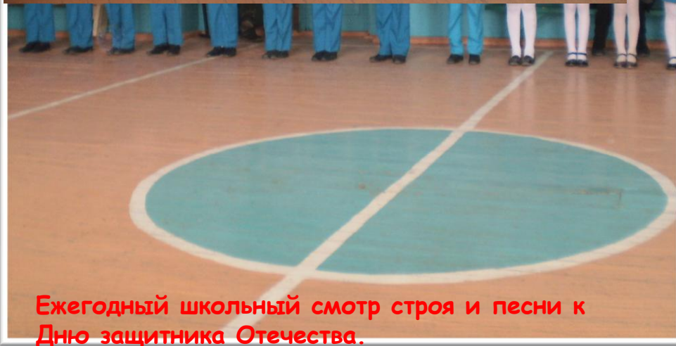
Ежегодный школьный смотр строя и песни к Дню защитника Отечества.