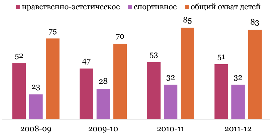
Диаграмма участия обучающихся в системе дополнительного образования вне школы