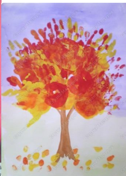
«Совушка - Со... Антонина Юсакова - 6