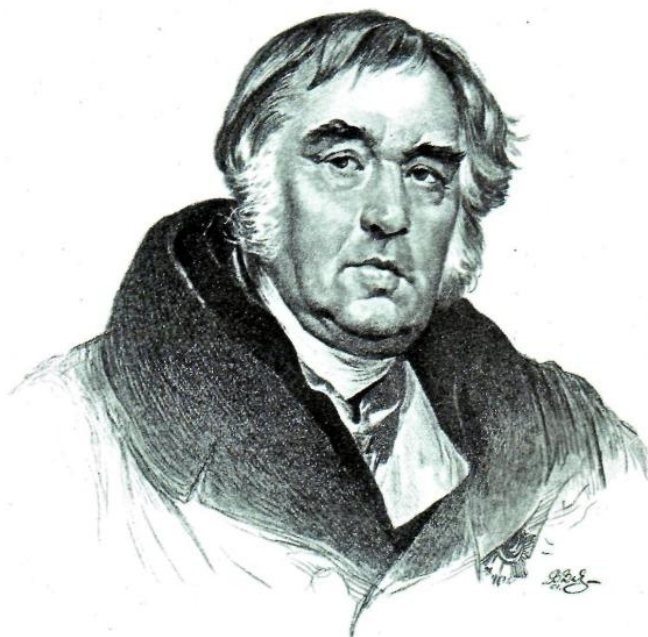
Иван Андреевич КРЫЛОВ (1769—1844)