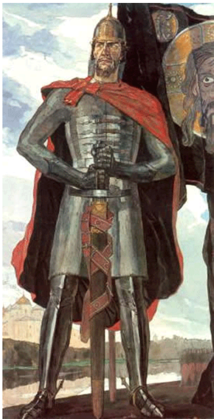
Александр Невский П.Д. Корин 1942 г.

Князь Александр Ярославич Невский родился в мае 1220 года в городе Переславле. С четырёхлетнего возраста его обучали владеть мечом, стрелять из лука и биться палицей, учили письменности и счёту.