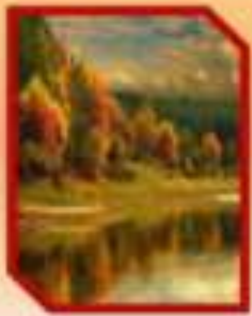
Autumn in the Park