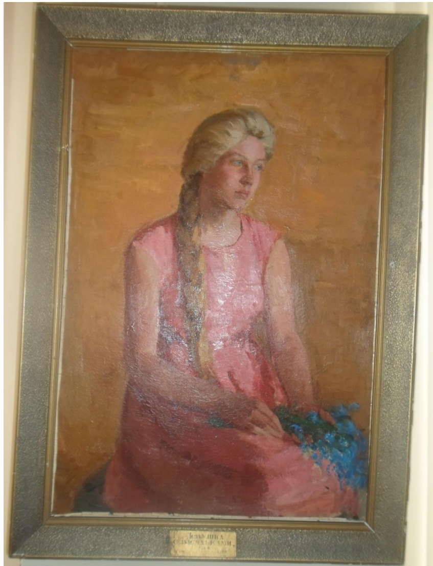
Девушка с васильками