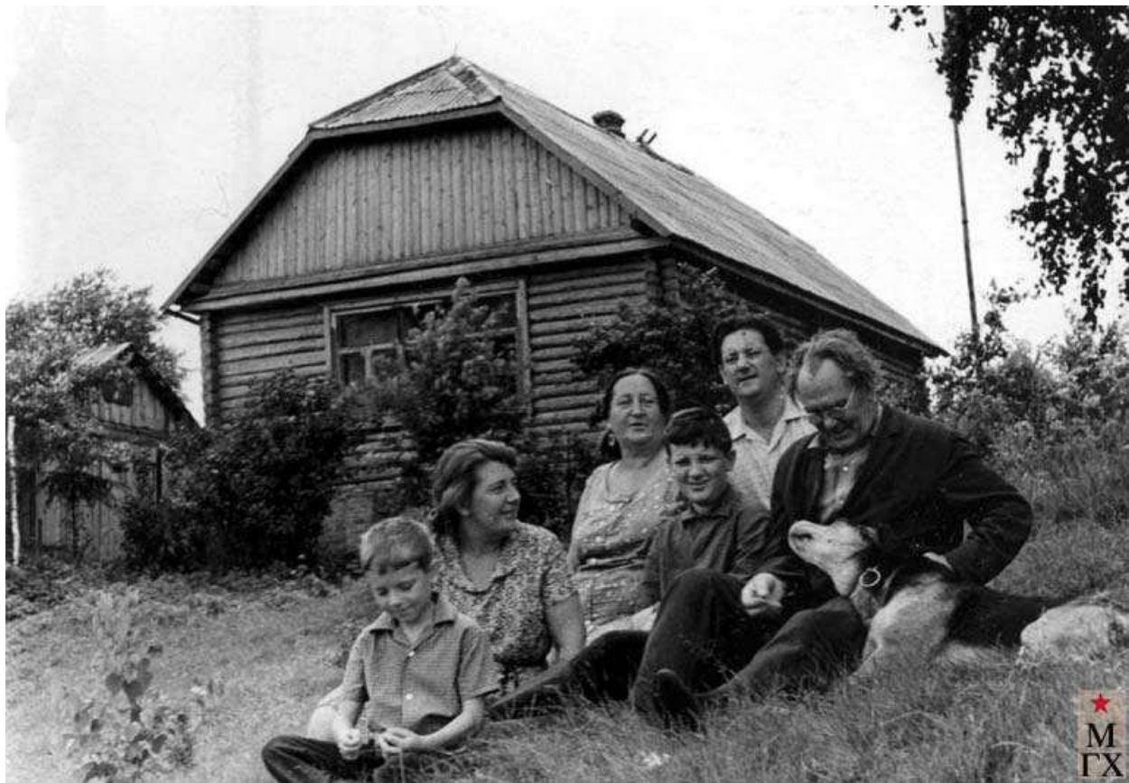
Ф.С. Шурпин с семьей