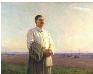
Утро нашей Родины

Сейчас картина «Утро нашей Родины» находится в запаснике Третьяковской галереи.