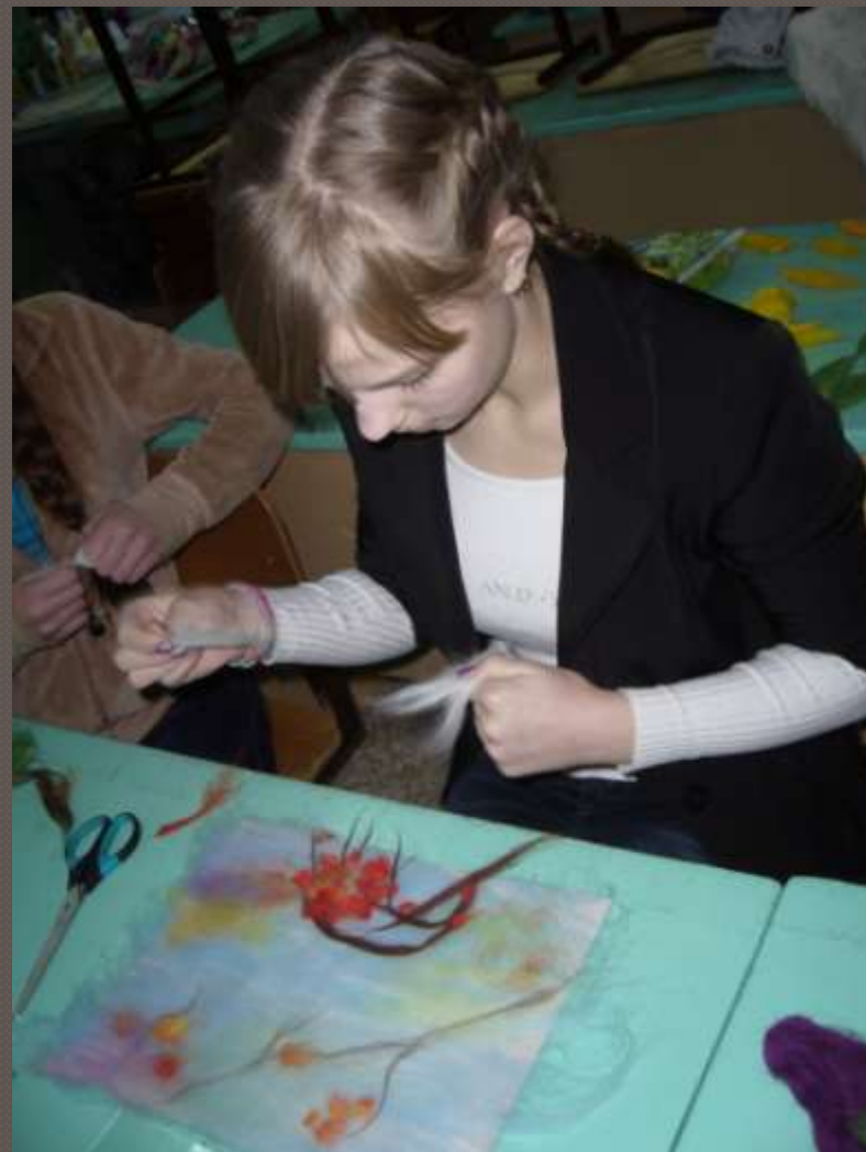
«Снегирь» - работа Поляновой Кристины