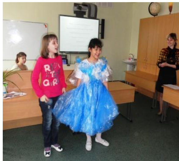
ученицы 4 класса