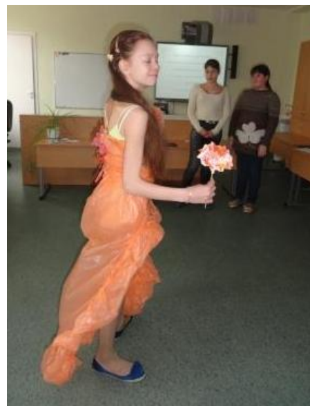
ученицы 6 класса