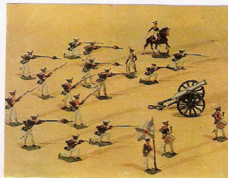
Россия 1812-1814 гг., пехота.