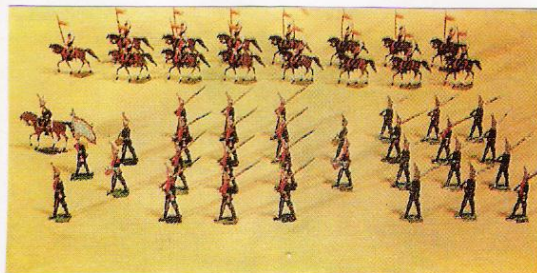
Россия 1910-1914 гг. Лейб-гвардии Павловский гренадерский полк, Лейб-гвардии Уланский полк.