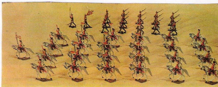
Россия 1910-1914 гг. Царскосельский гусарский полк, гвардейская пехота.