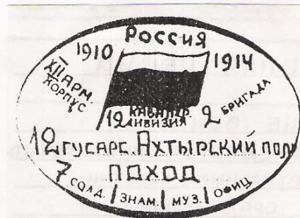
Этикетка на крышке коробки