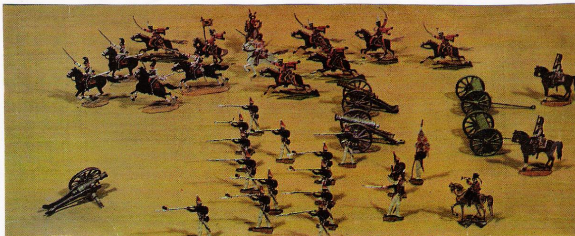
Россия 1812-1814 гг. Павловский гренадерский полк, Кавалергардский полк, Лейб-гвардии гусарский полк.