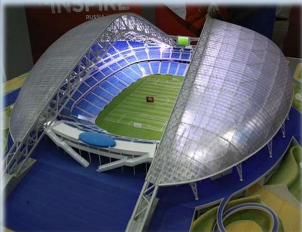
Олимпийский стадион в Сочи.