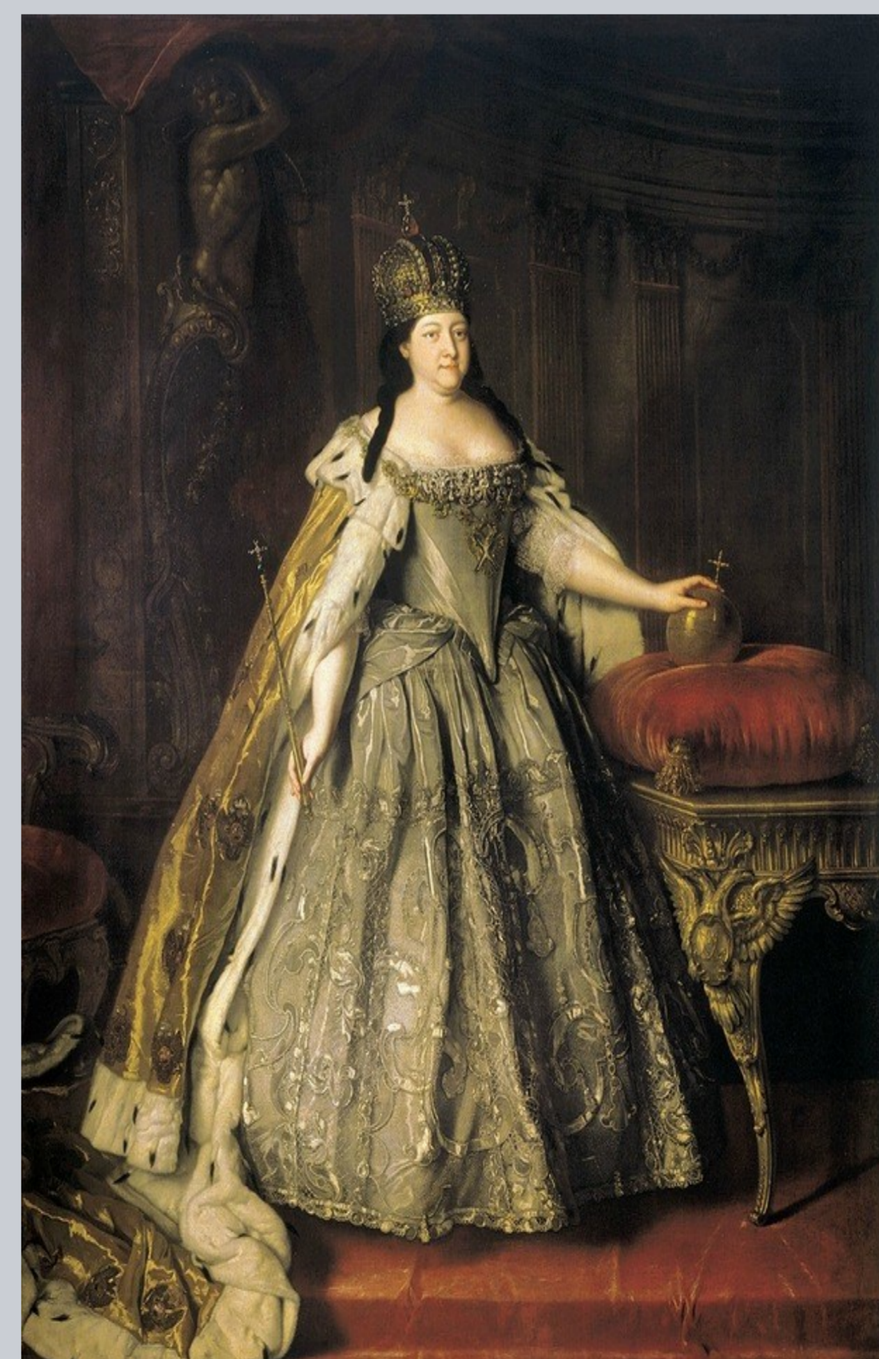
Анна Иоановна 1730-1740