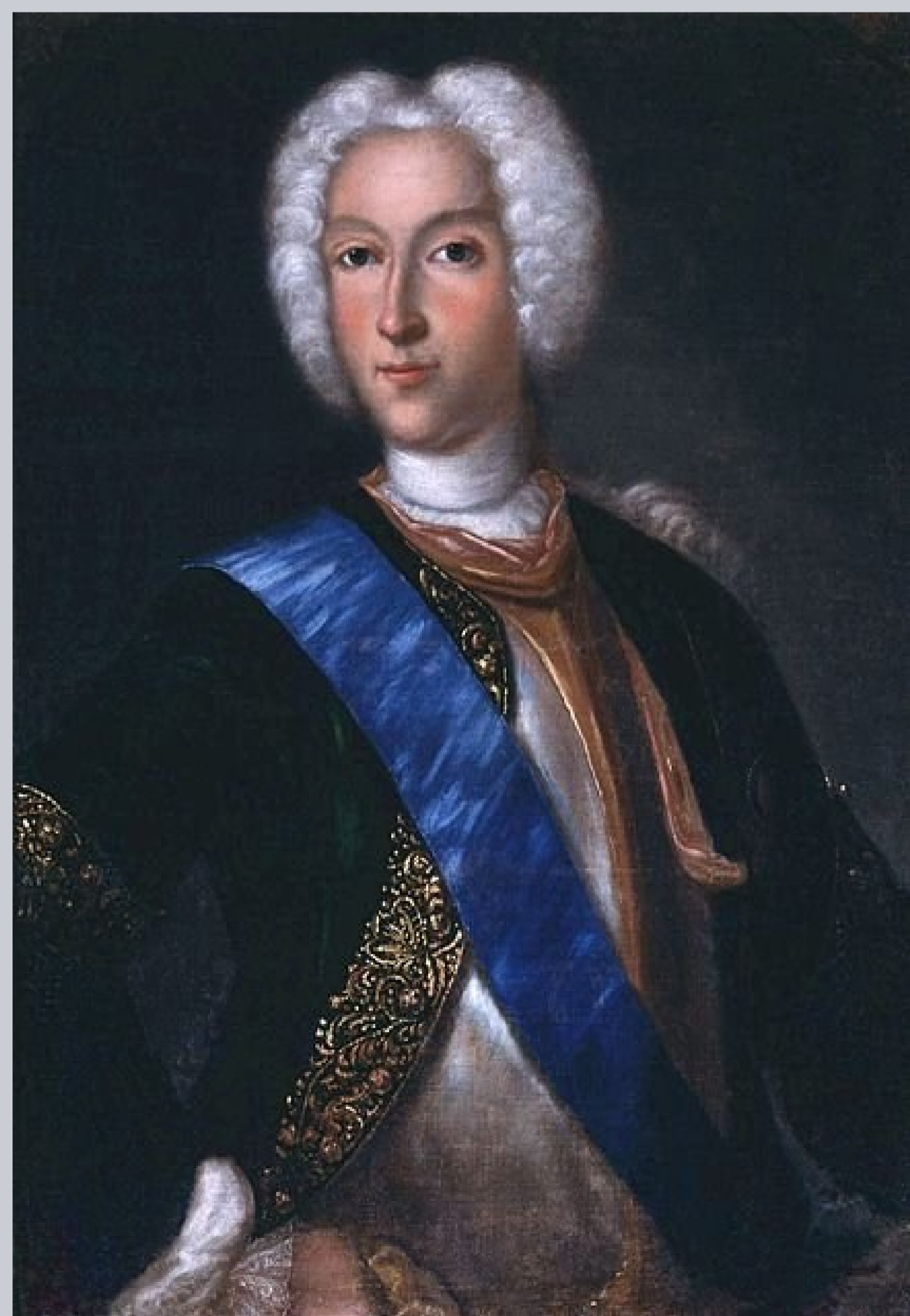
Петр II 1727-1730