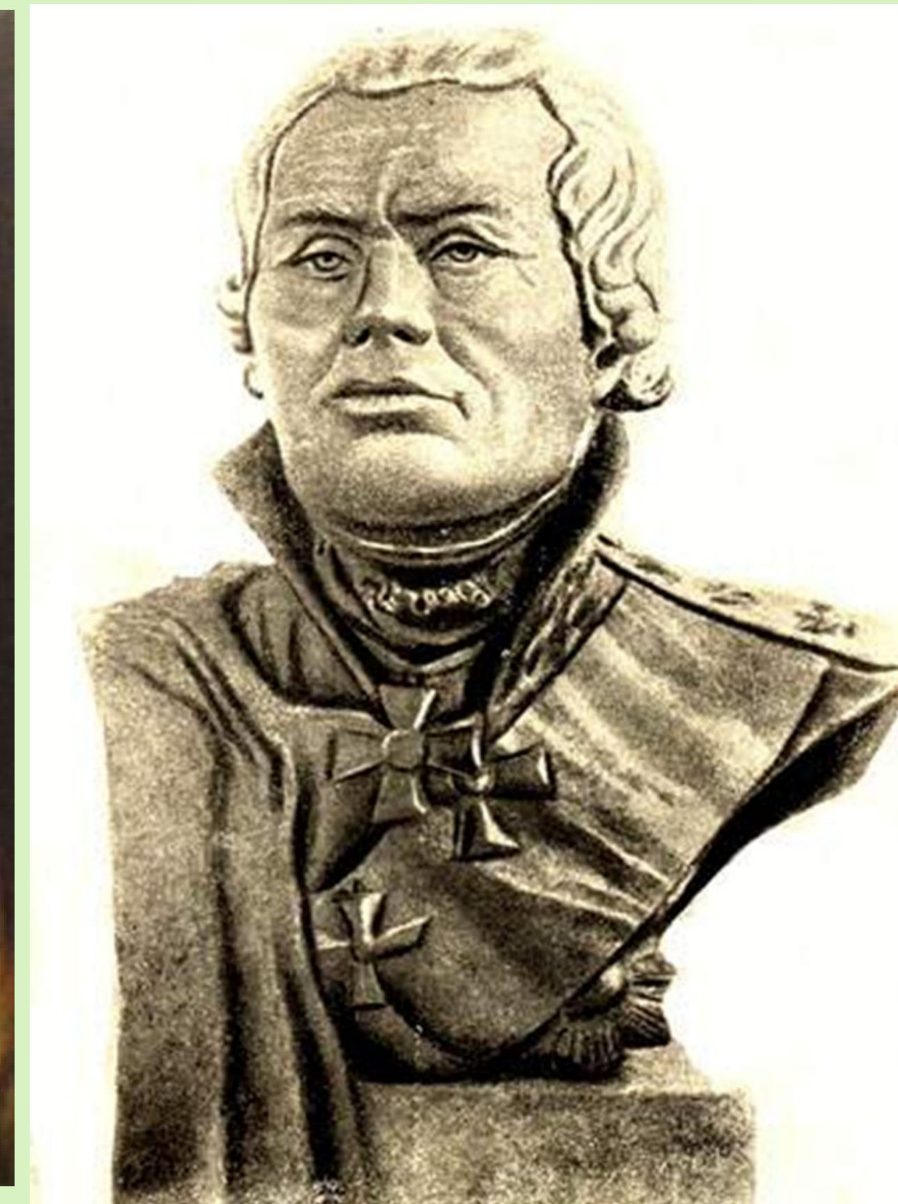
Федор Федорович Ушаков