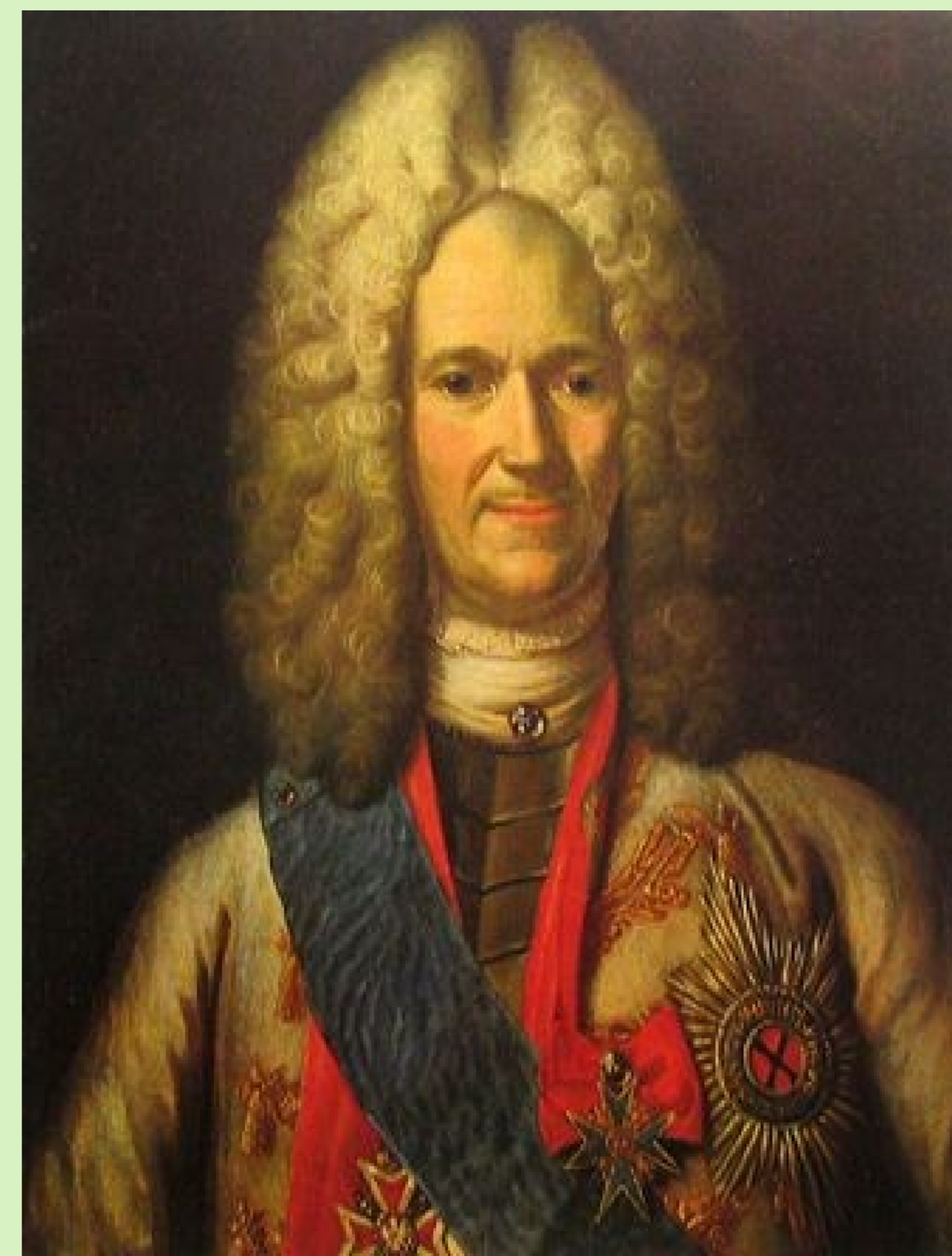
Александр Данилович Меньшиков