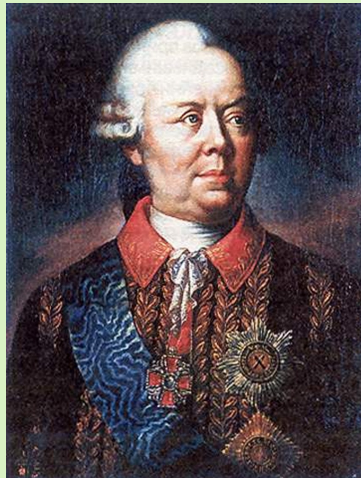
Петр Александрович Румянцев