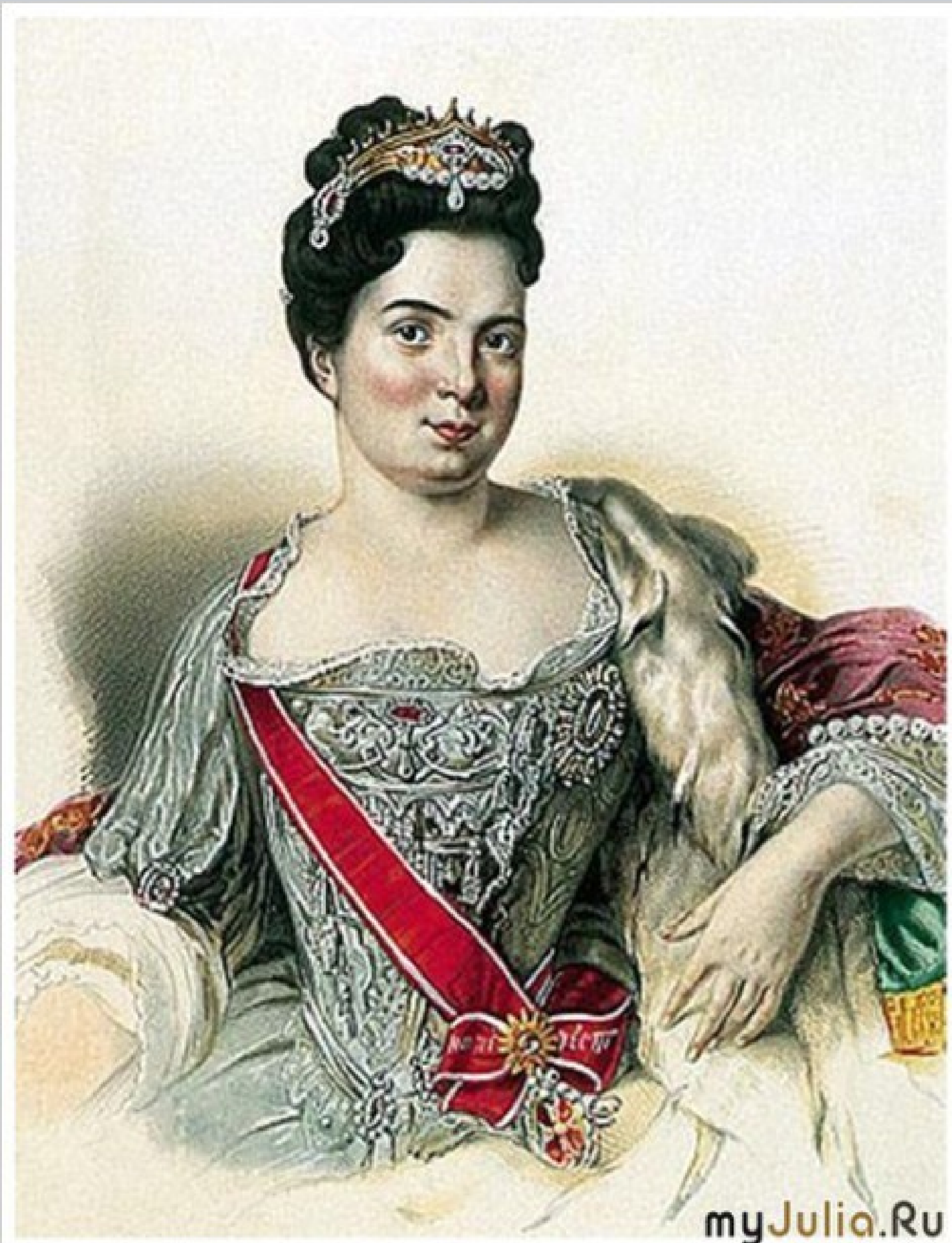
Екатерина I 1725-1727