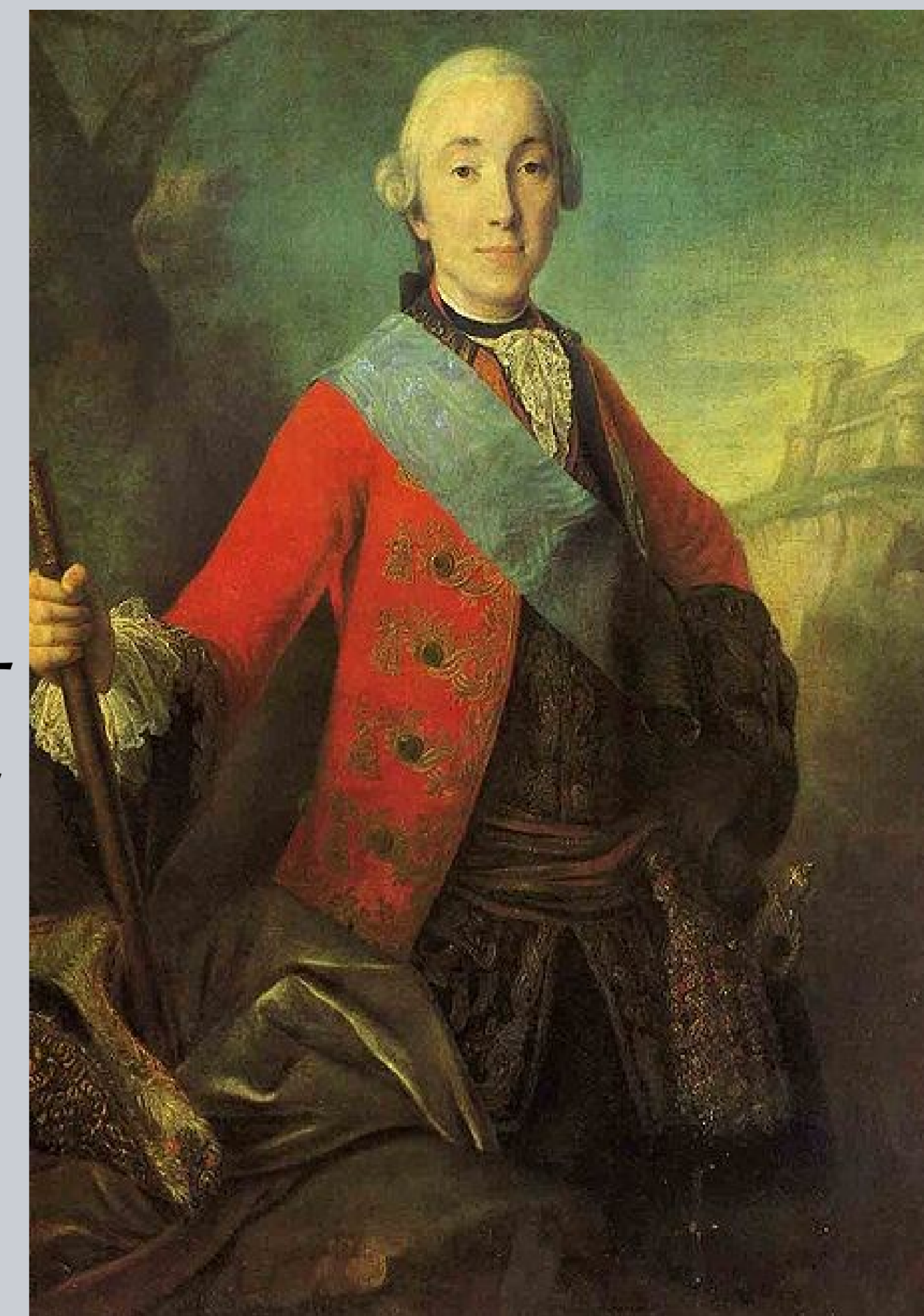
Петр III 1761-1762