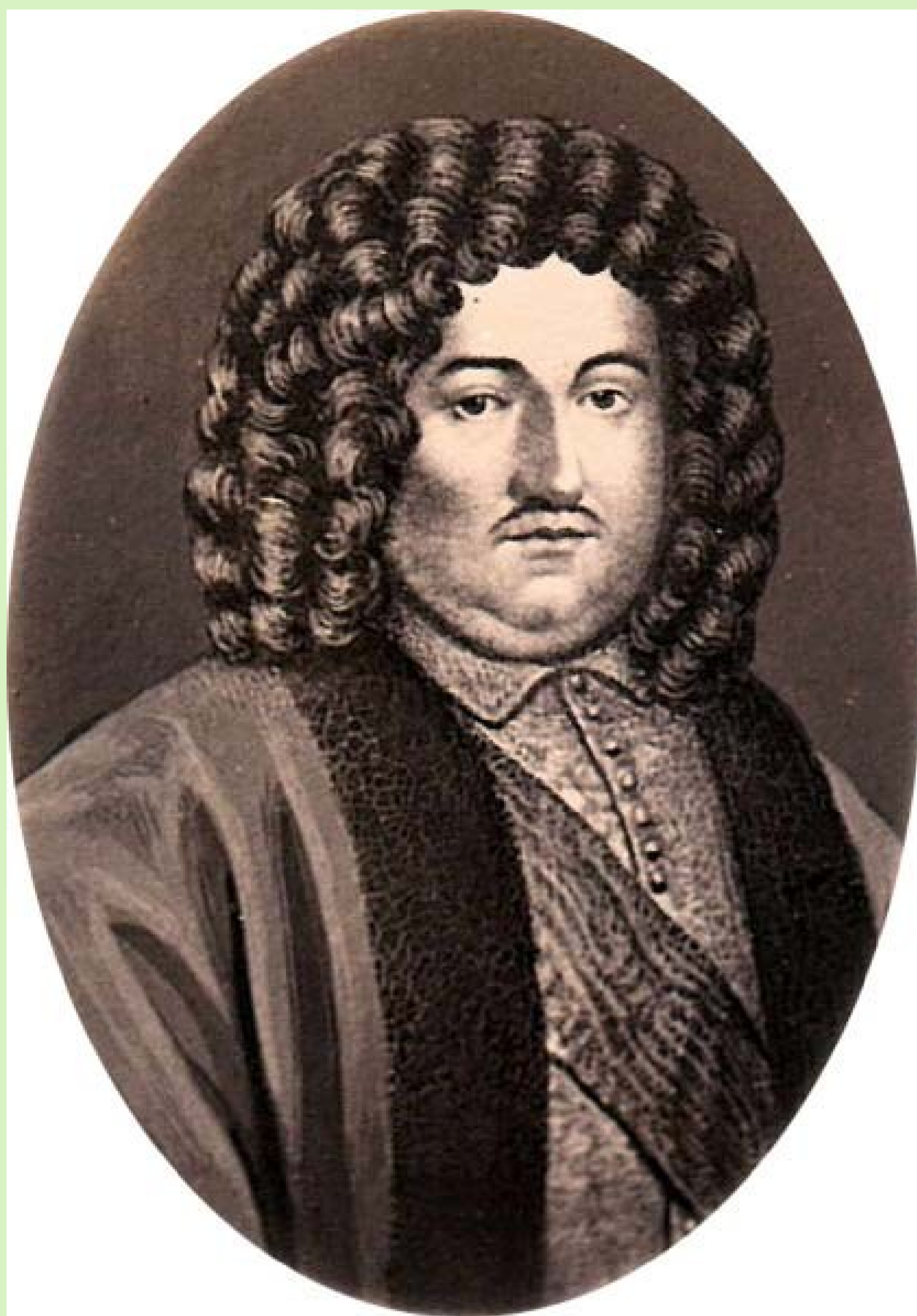
Федор Алексеевич Головин