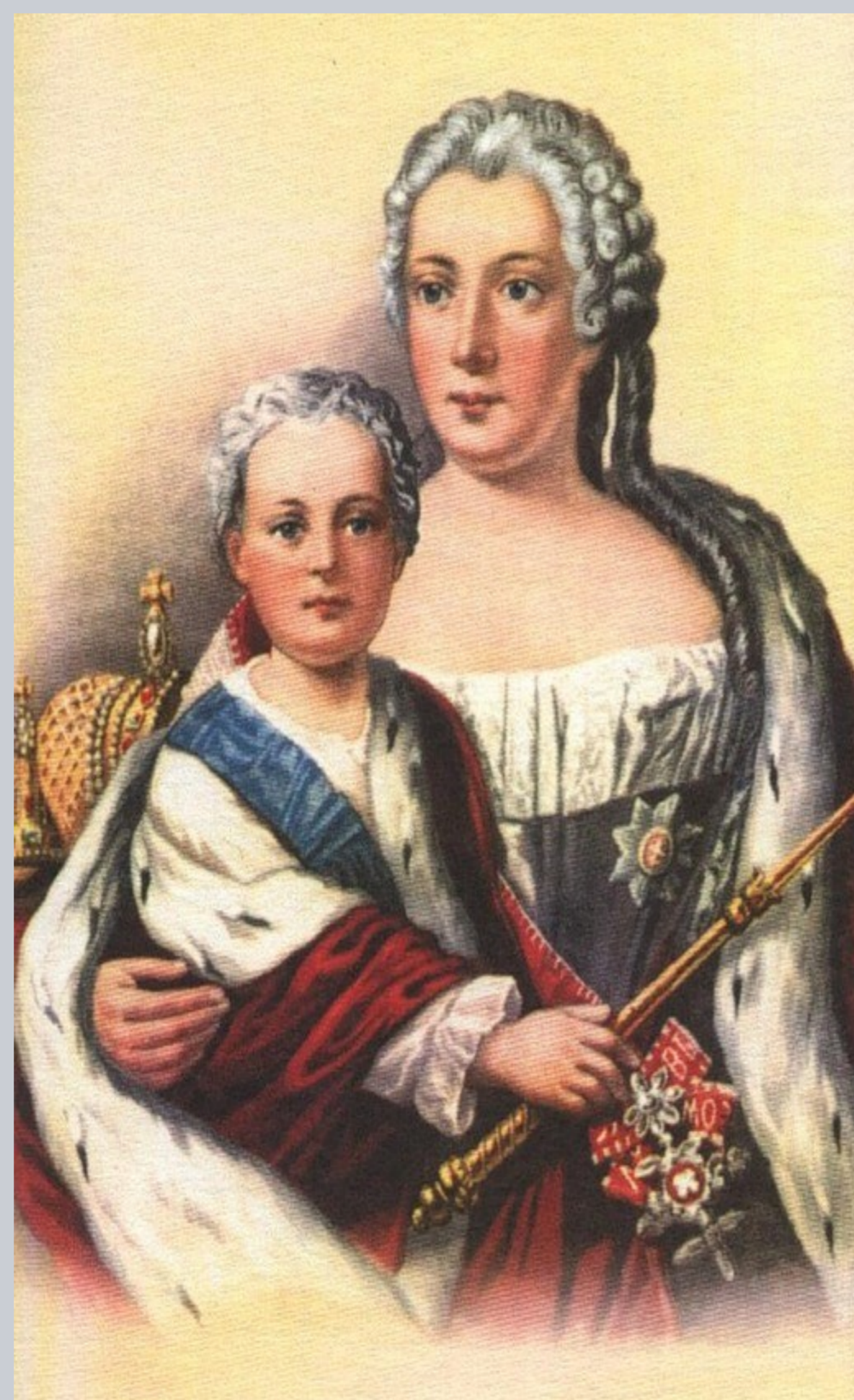
Иван VI Антонович 1740-1741