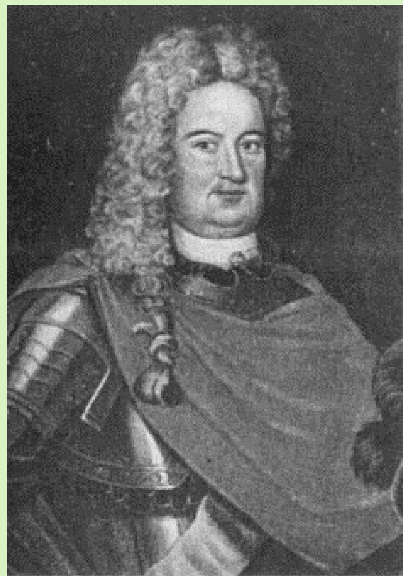
Борис Петрович Шереметьев