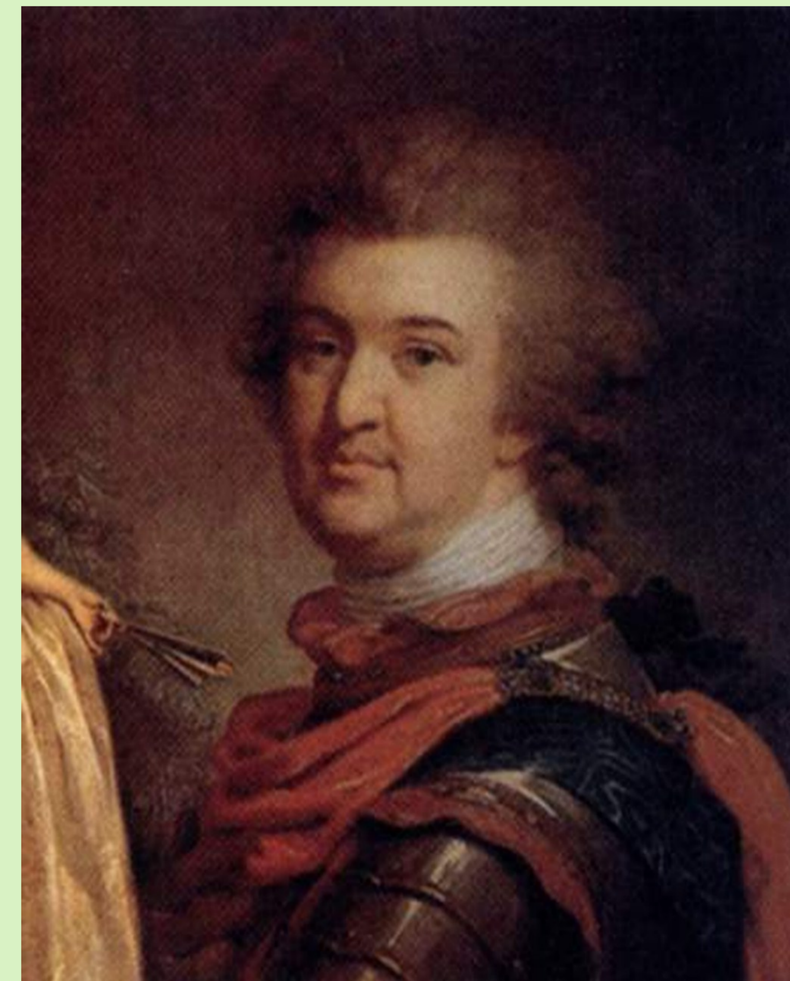
Григорий Александрович Потемкин