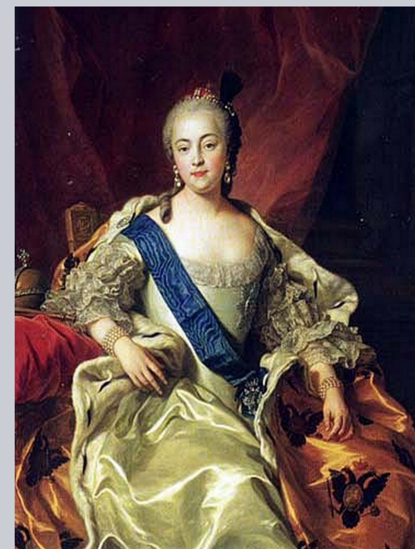
Елизавета Петровна 1741-1761