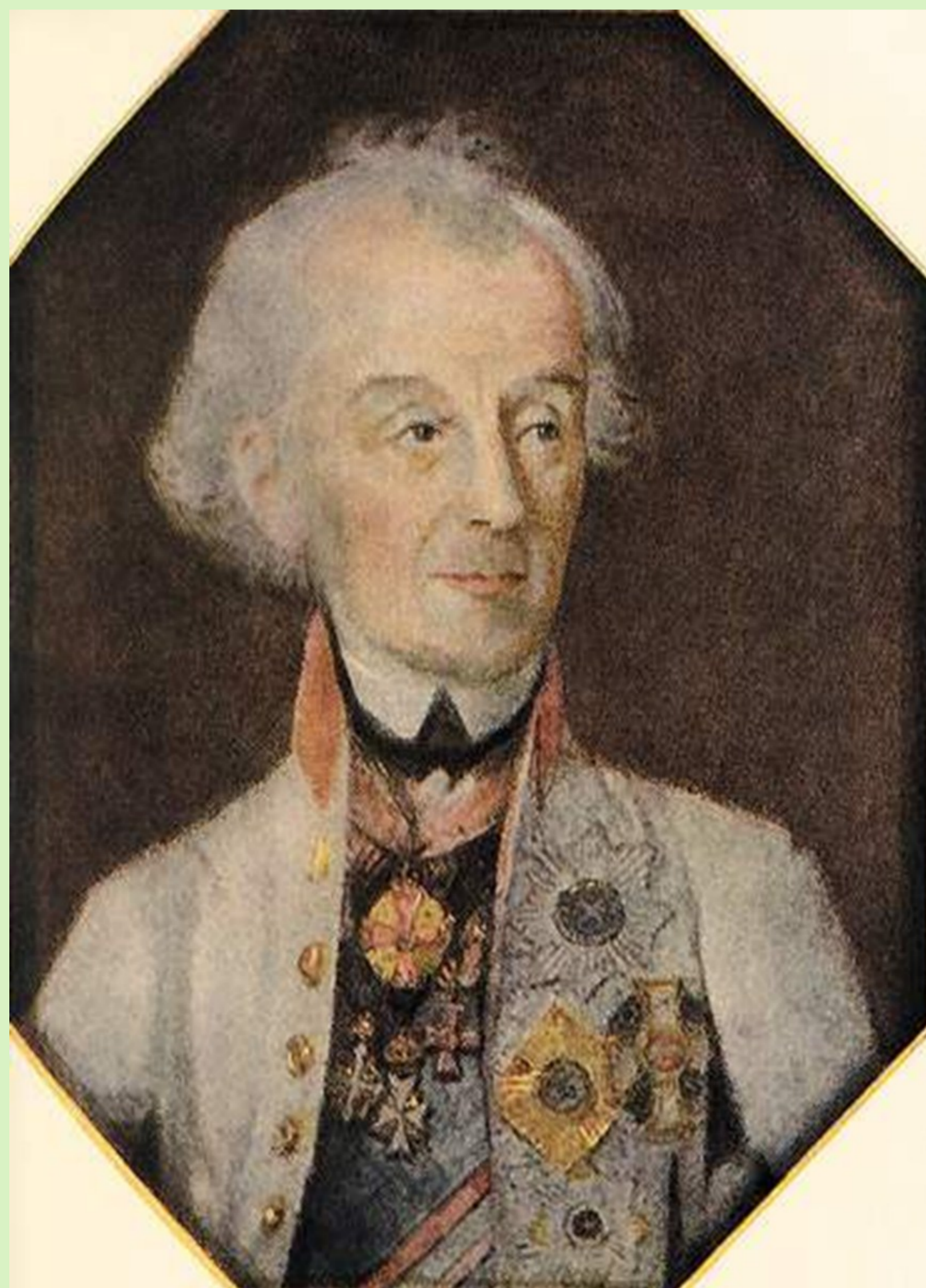
Александр Васильевич Суворов