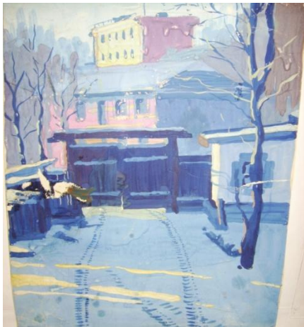
Плоскостная (фронтальная) композиция