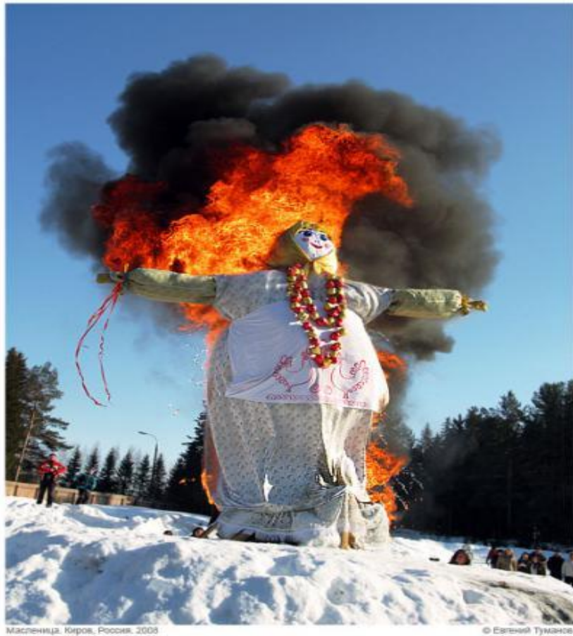
Масленица. Киров, Россия. 2009