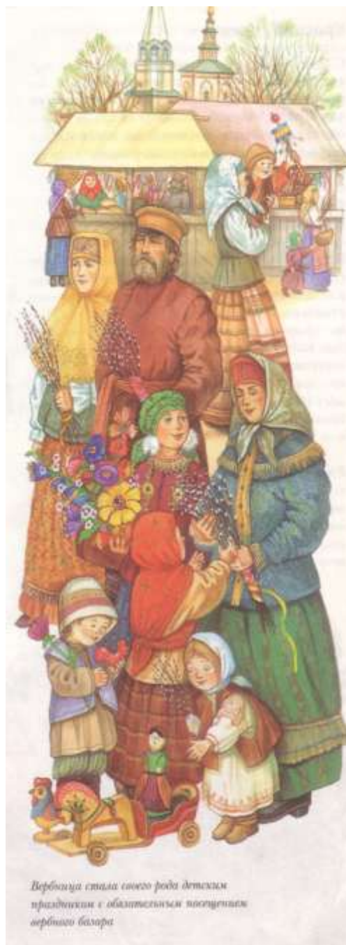
Вербашица стала своего рода детским праздником с обязательным присутствием вербного базара

Мы обмениваемся на Пасху красными яичками, говоря «Христос Воскресе!» Этот обычай очень давний. Яйцо – это знак жизни. Мы ведь знаем, что из яйца выходит живое существо. Окрашивается в красный цвет оно потому, что Христос своей кровью освятил жизнь. Христиане на Пасху приветствуют друг друга красным яйцом как знаком вечной жизни.