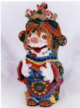
ил.55 Кукла «Мой дом – моя крепость» (40х24х41 см)

Простите, скажите, Я не буду скучать, Носить я бочок, Хлеб и колбасу.