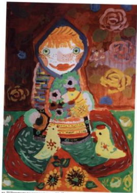
ил. 50 Интерьер по мотивам украинки (61х42 см)