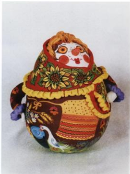
ил. 64 Кудамына «Венера русская» (22х16х32 см)

Ткань из улья, Маляр из французской, Я - Венера русская.