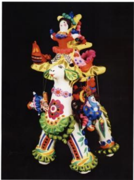
рис. 87 Скульптура «Счастье» (20х15х30 см)

Мы хотим счастья, Никого не жалея. Мы в царя выстушим И всех нас оприцаем.