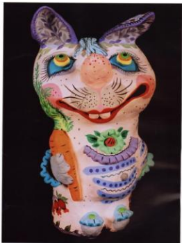
на, 62 Куклы-членики (31х28х58 см)

Домой возвращаю вместе со мной, Виделись - выросли и дали потом, Теперь угадай-ка, что же я другой?