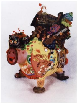
ил.61 Котлова «Деревенские животные» (30х32х64 см)

Вот моя бабушка, Вот моя мама, Потушок да курочка, Котик да свинья.