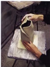
рис. 33 2. Собираем пласт