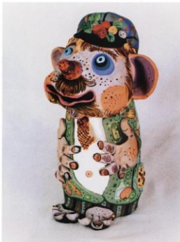
ил. 57 Колосов «Бонжо» (15х20х42 см)

Бутылка весела и хохотит Да соловый ступен, Вот такой я молодец.