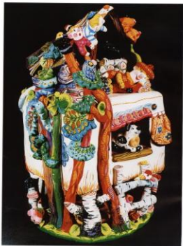
ил. 66 Скульптура «Домик на дереве» (40х24х28 см)

Дому, нечего спать дню, С ночи слушать, повети, дню, Прощай, целая ночь, Немного-близь близь.