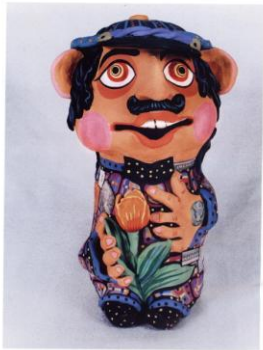
ил.56 Кукла «Посыланье» (36х22х44 см)

Красно, горько, что явился, В доме счастливый угод, Проставьте и нам на это, Дайте куры неслились,