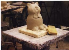
ил. 35 4. Дополняем деталями. Заглаживаем поверхность.