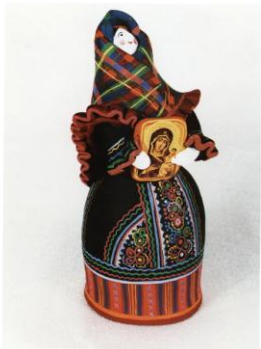
выс. 70 Скульптура «Русь старая» (10х15х20 см)

Богородица святая, Богородица наша, Это Родина родная, Наша русская земля,