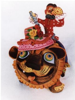
ил. 63 Кукла «Тигр счаст» (28х22х44 см)

На нем сидит наш Феликс, Тигр счастливо сидит: «Порхает, веселый парик, Соберётся и пропоем».