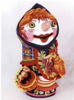
мн. 79 Катерина «Вісниця» (40х22х44 см)

Скромність, мов, як мов. Бог поше на дітях, мов.