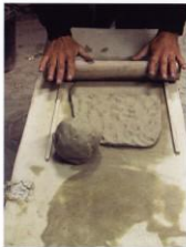
рис. 32 1. Раскатываем пласт