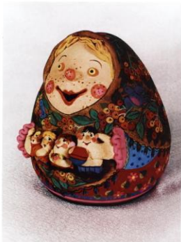
м. 67 Кукла «Паньчужка» (18х16х12 см)

Туди сонця уриваний рос, Рідний мій ой опрост, Дітишка моє у мене, Богаче мого, коханий, а.