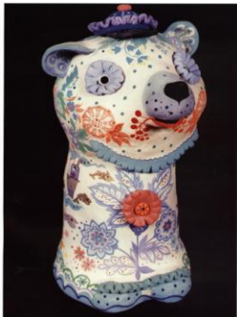
изд. 89 Кукла «Милая женщина» (20x30x40)

Бисел, белая, Коричневый, белый, Лаккер розовый, Дно - ... (цветной)