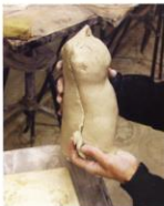
ил. 34 3. Уточняем форму.