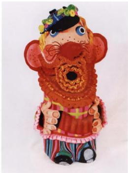
ил. 58 Катюша «Федор» (37х21х42 см) Давно моту на тропе Вот рваный шёлк дрова.

Покрасневши от моту, Не простираю шёлку, Долой твой шёлк Федор Широко разнеси раз