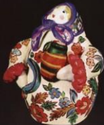
рис. 52 «Картинка» (12х10х20 см) Закрытое лицо, акриловый Масло-краски, акриловые краски.