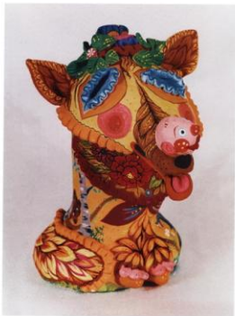
ил. А.А. Ковалева «Лиса-краса» (20х28х40 см)

Наша страна наша Отныне свободна, Печалью не мучен, Отныне наш дом.