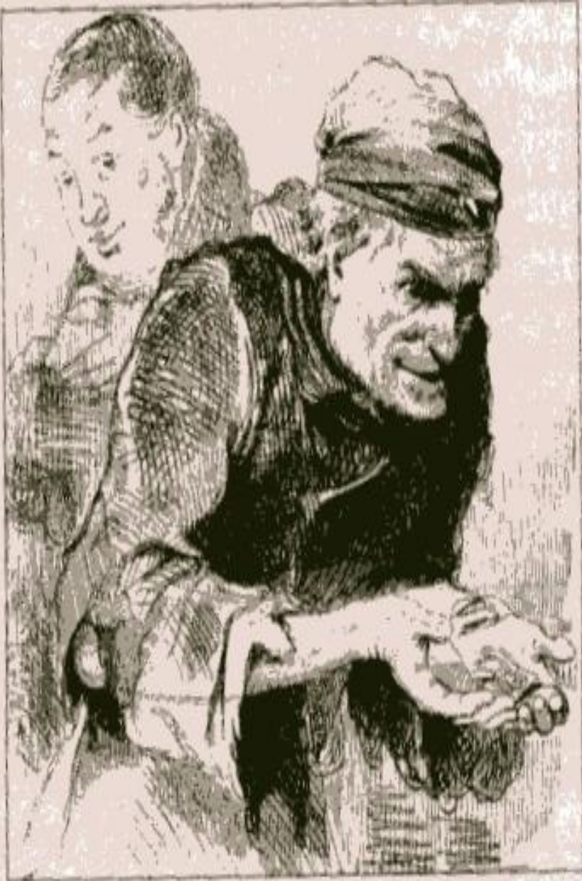
Иллюстрация А. Агина. 1892 г.