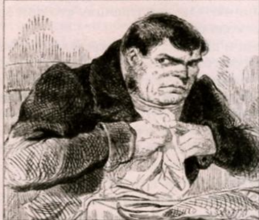
Иллюстрация А. Агина. 1892 г.