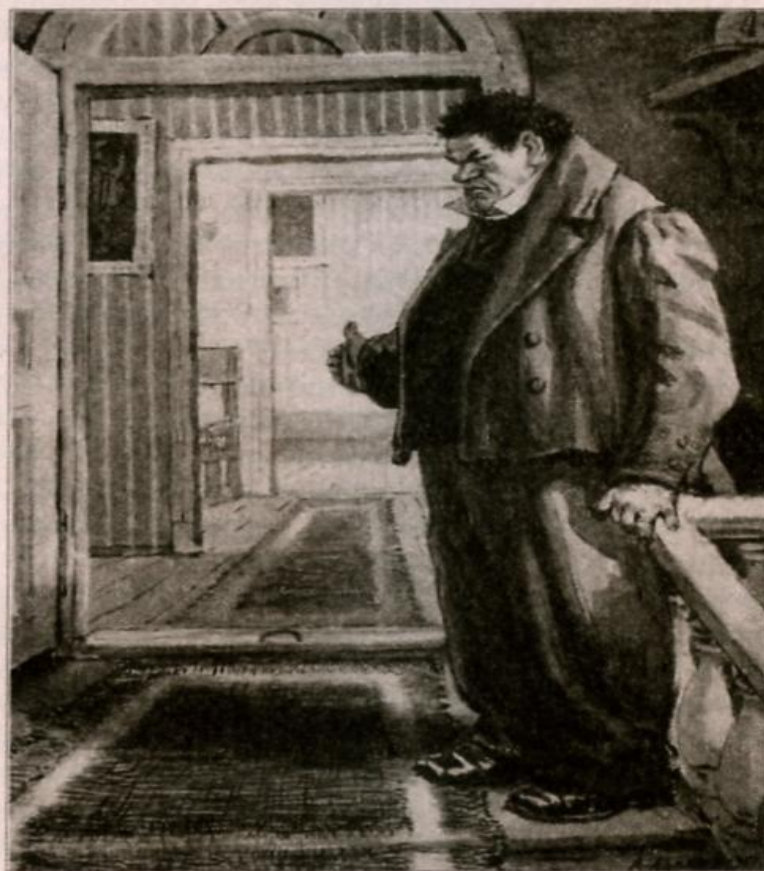
Иллюстрация А. Лаптева. 1950—1952 гг.