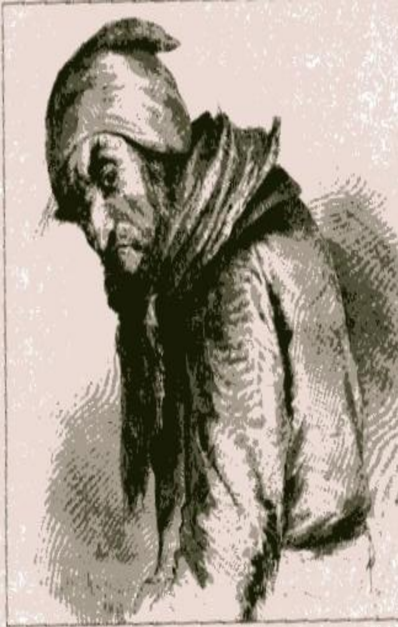
Иллюстрация П. Боклевского. 1866–1874 г.