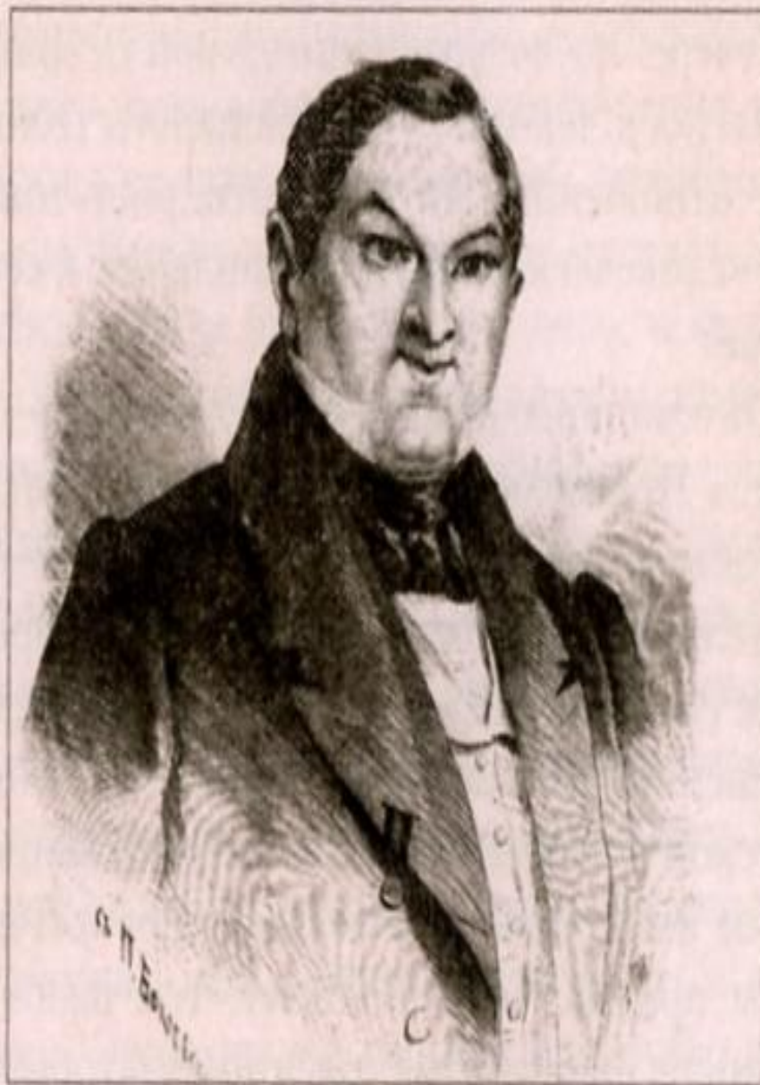
Иллюстрация П. Боклевского. 1866—1874 гг.