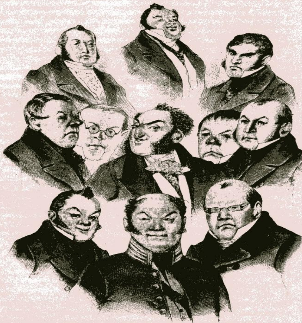
«ГУБЕРНСКИЙ ОЛИМП» Иллюстрация П. Боклевского. 1866—1874 гг.