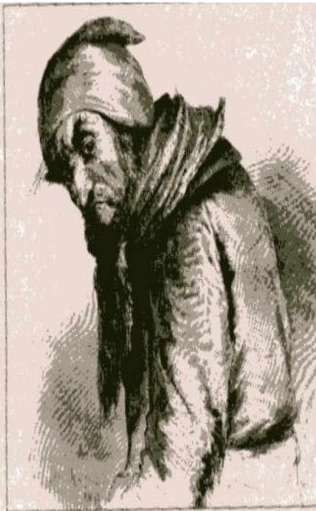
Иллюстрация П. Боклевского, 1866–1874 г.