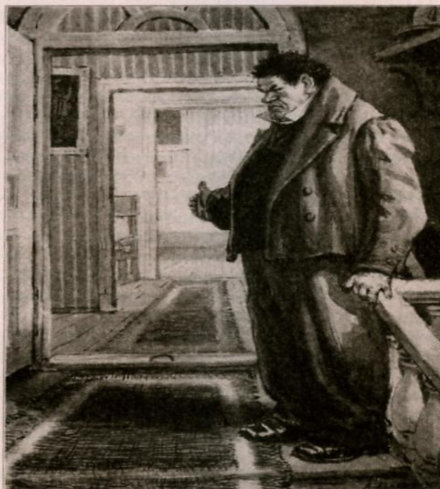
Иллюстрация А. Лаптева. 1950—1952 гг.