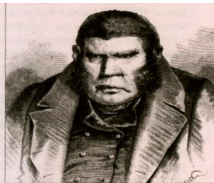
Иллюстрация П. Боклевского. 1866—1874 гг.