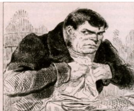
Иллюстрация А. Агина. 1892 г.