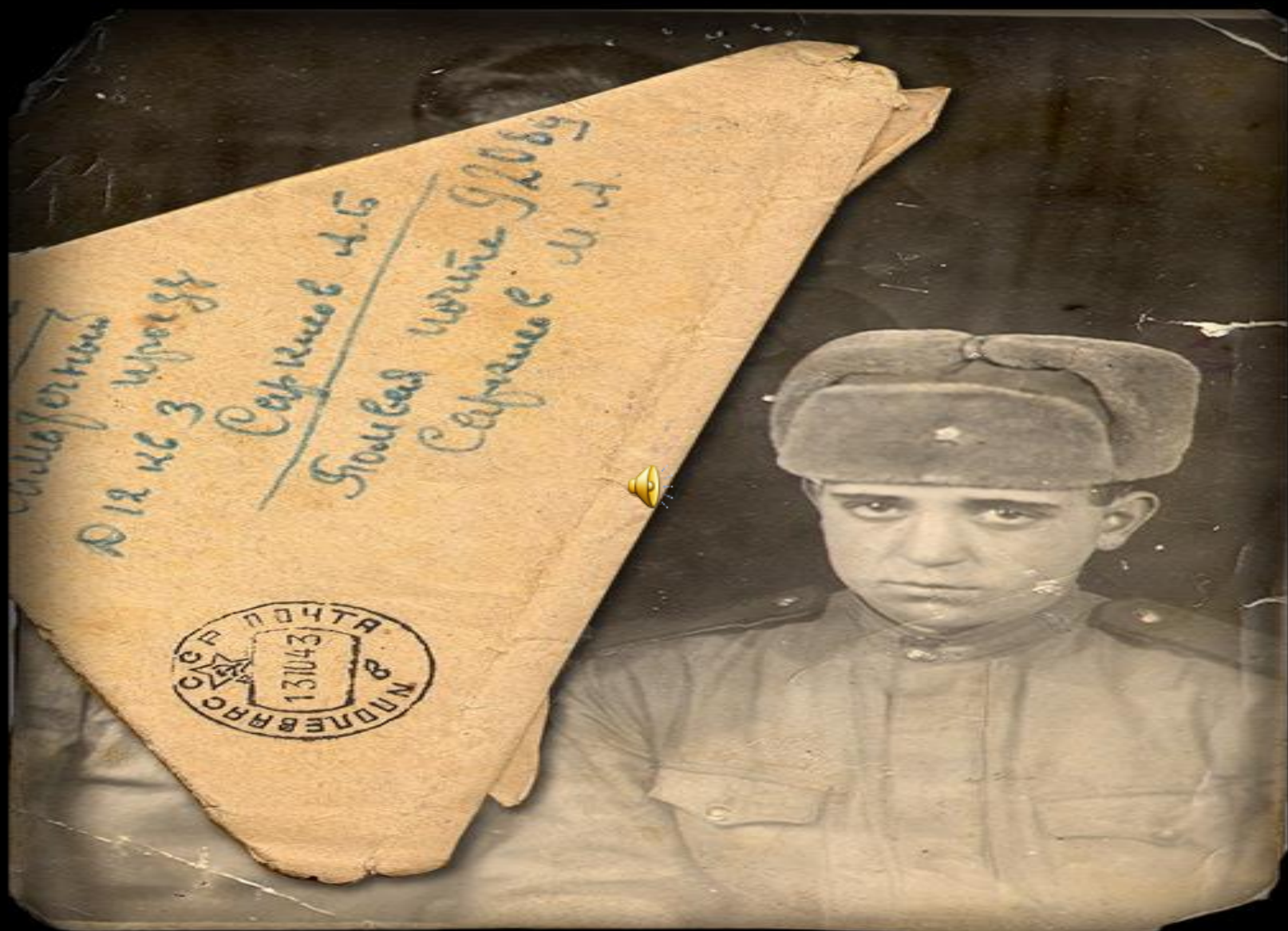
ПИСЬМО С ФРОНТА