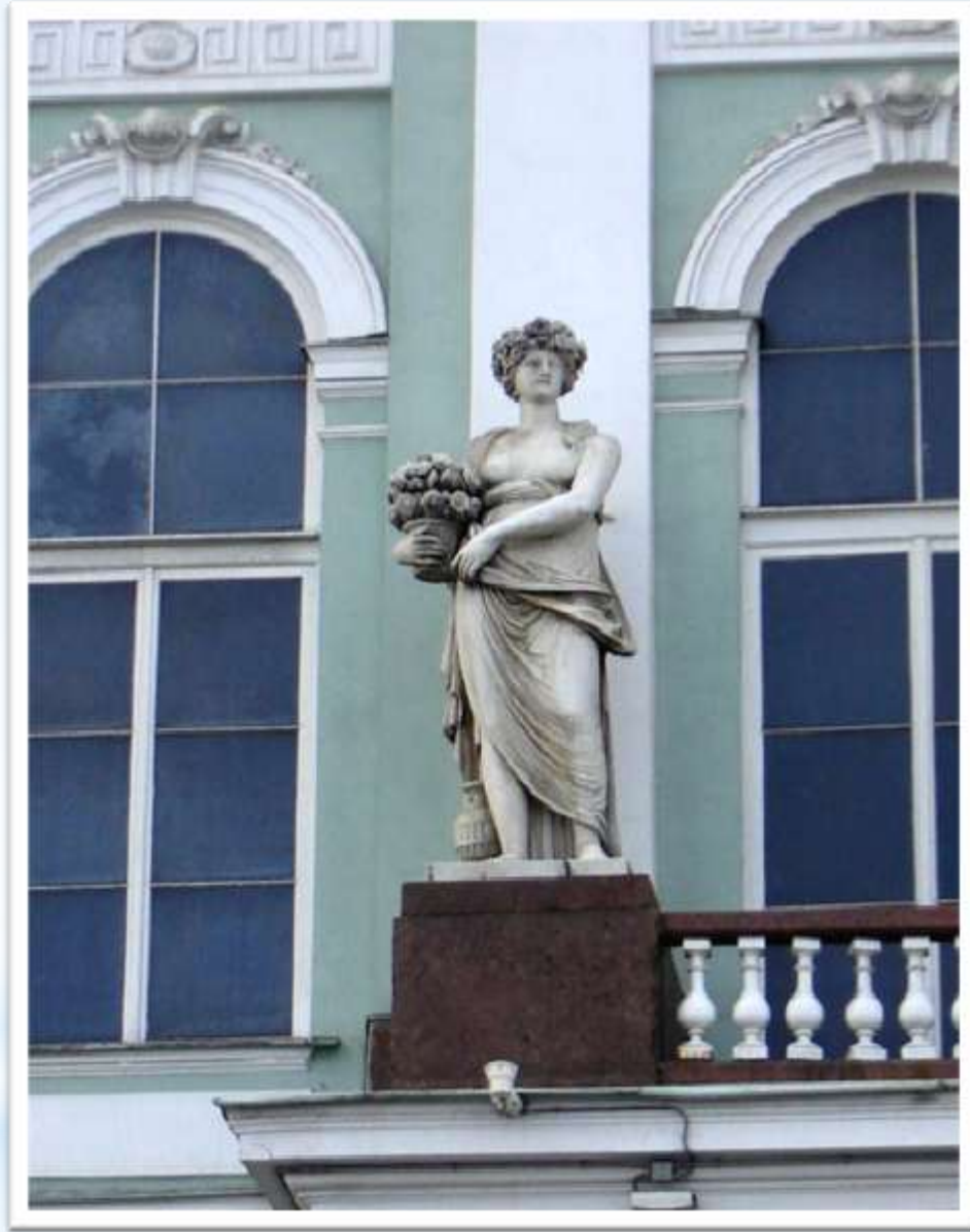
Статуя древней богини Флоры