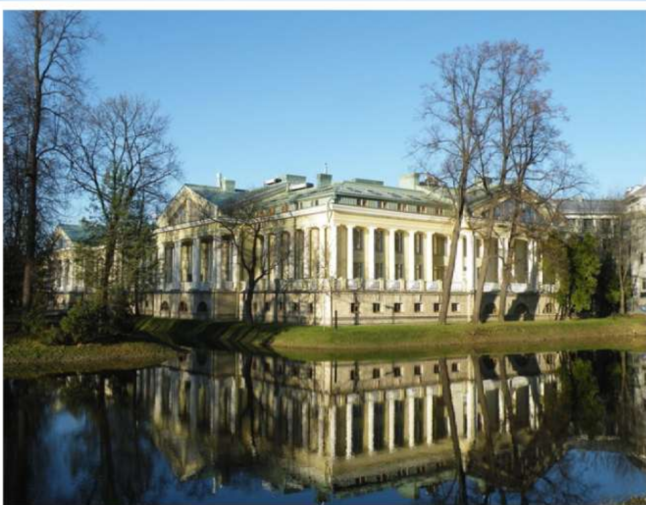
Каменноостровский дворец (Каменноостровский пр. 1)