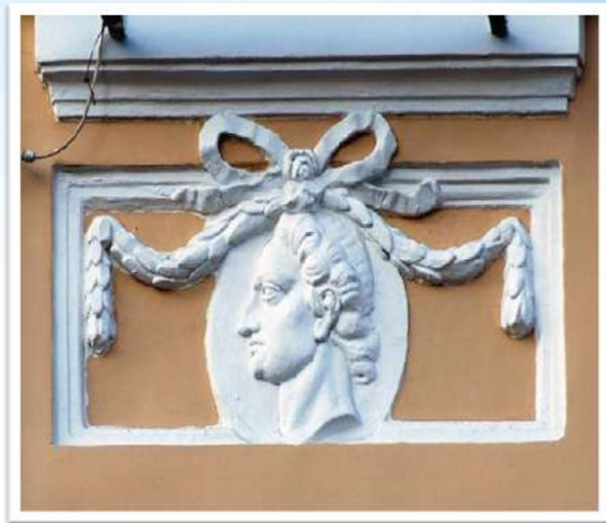
Фрагменты фасада (лепные медальоны, вазы, гирлянды)