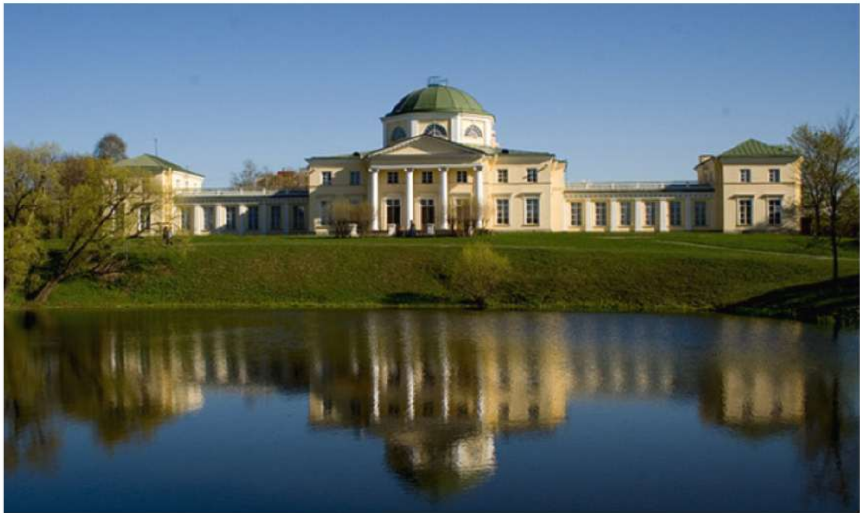
Усадьба Александрино (проспект Стачек 162)