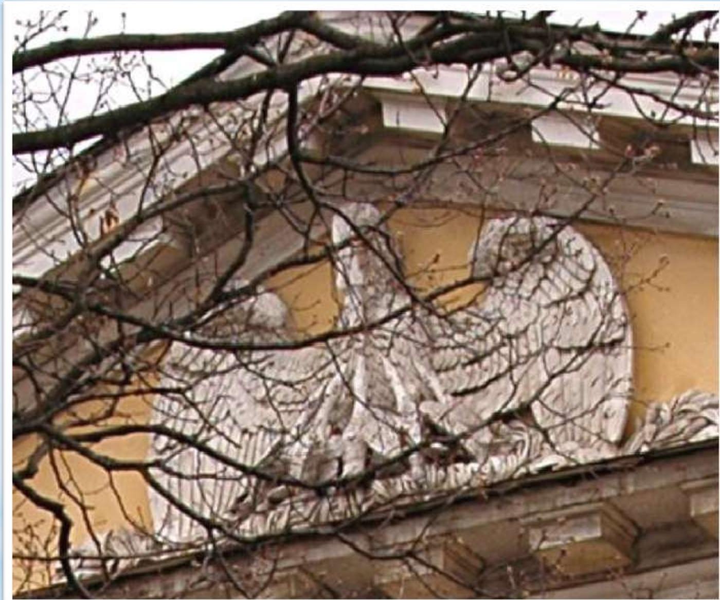
Горельеф «Пеликан с птенцами.»