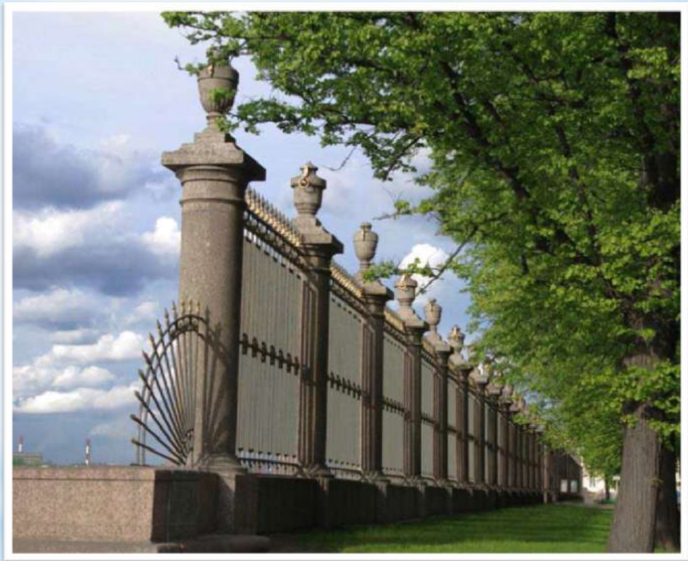
Решетка Летнего сада