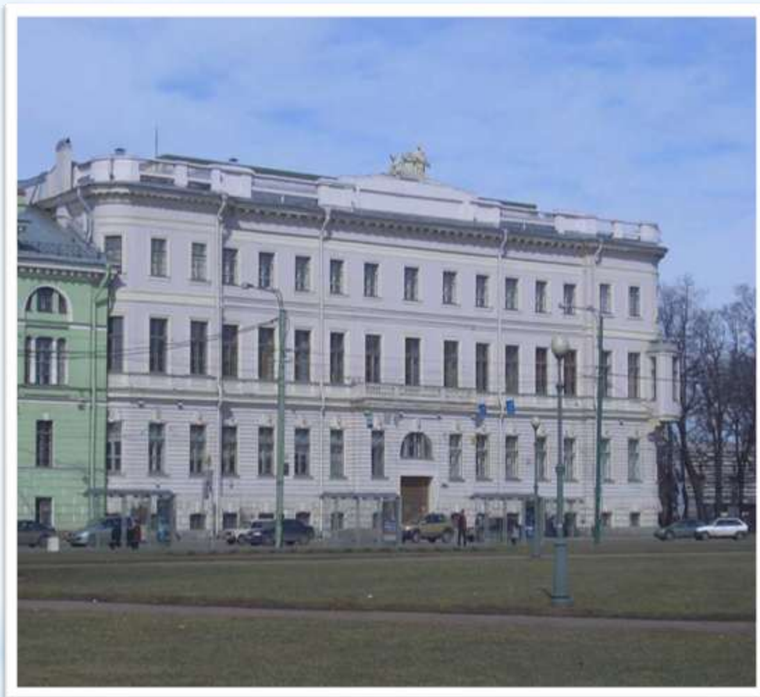
Дом И.И. Бецкого (Дворцовая набережная 2)