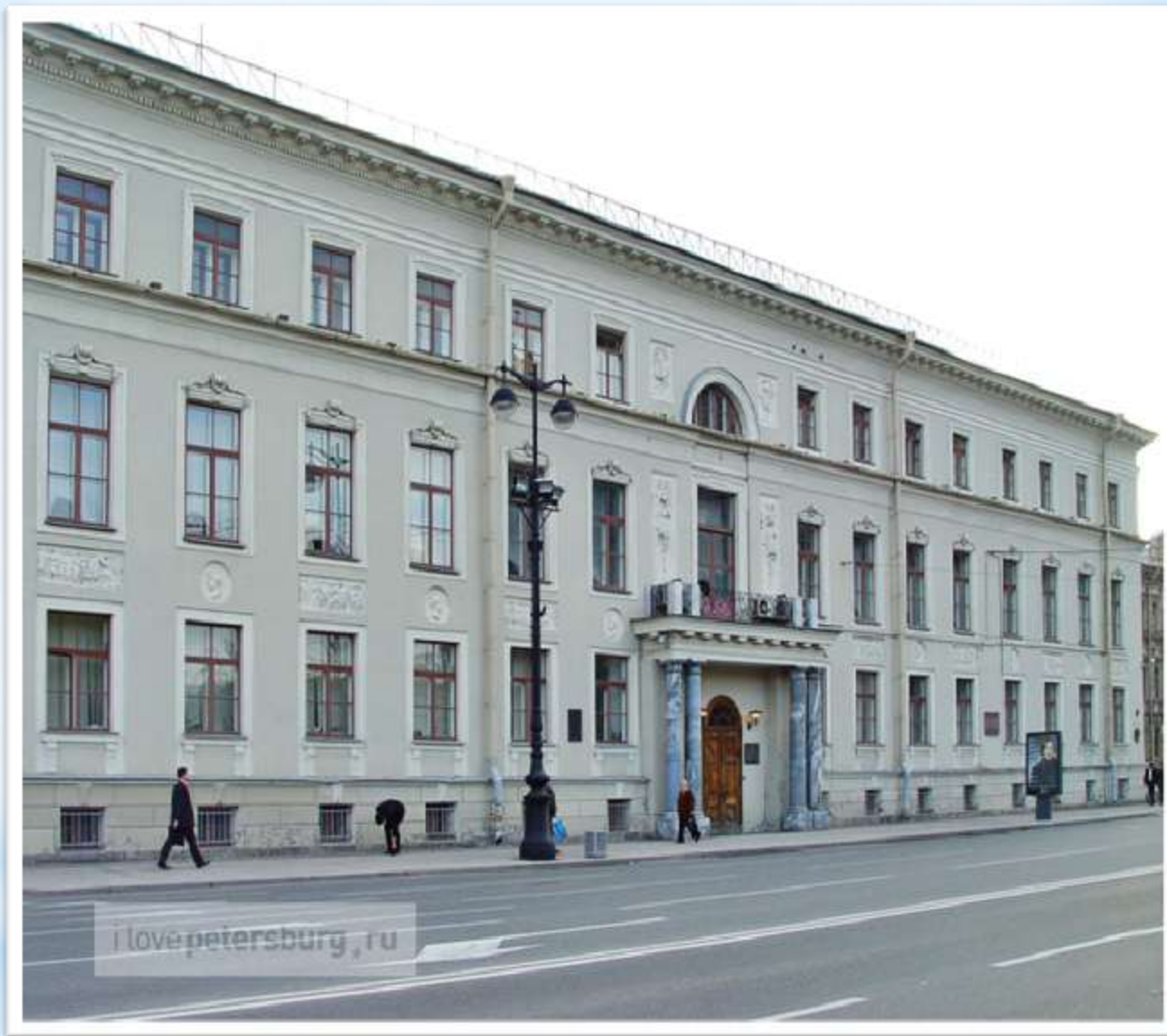
Дом Мятлевых (Исаакиевская пл.)