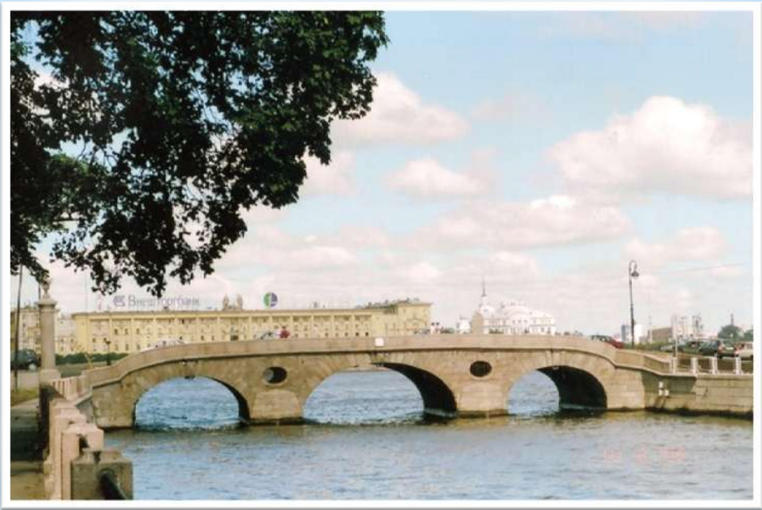
Прачечный мост (через Фонтанку по Дворцовой набережной)