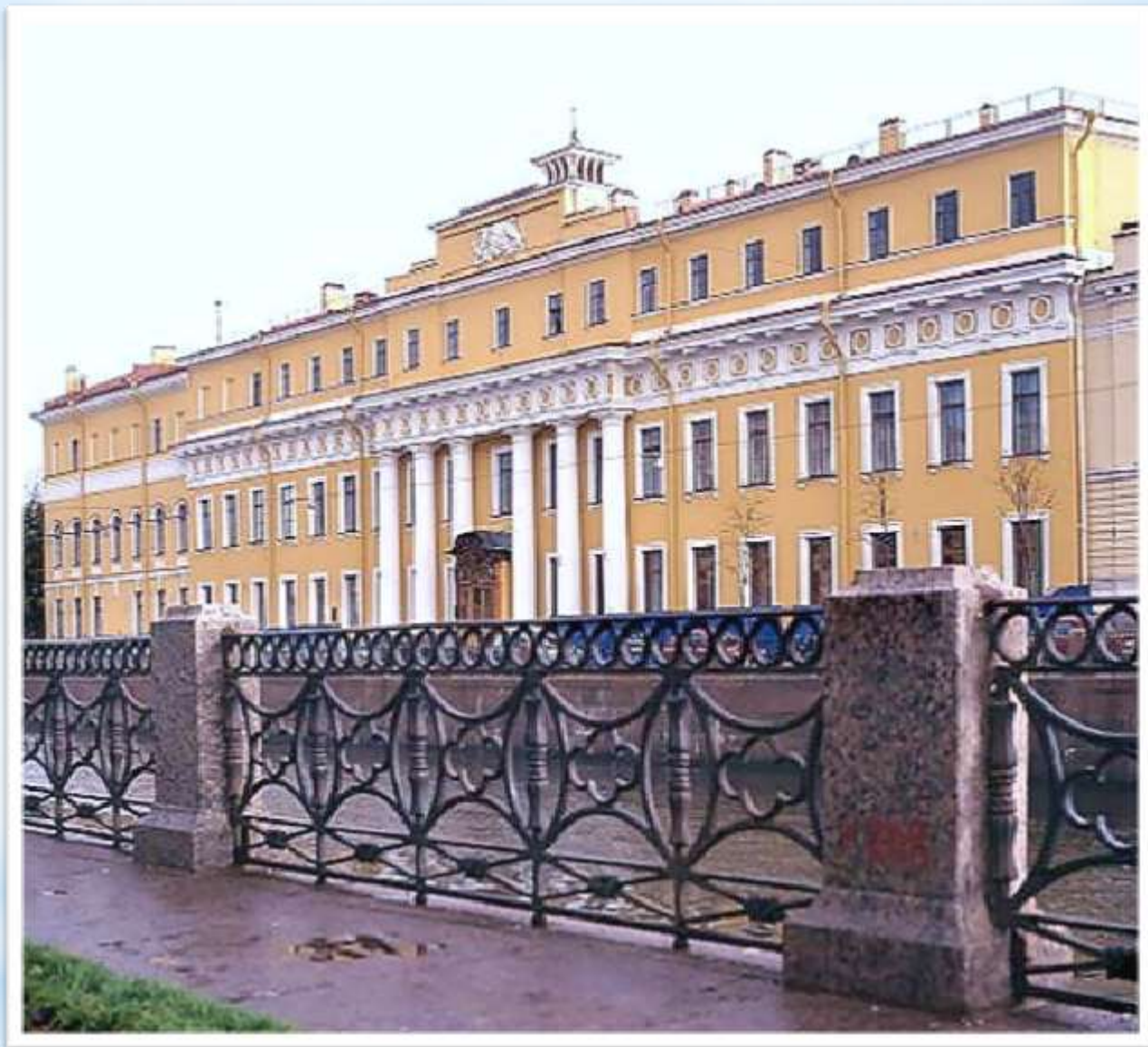
Юсуповский дворец (набережная реки Мойки, 94)