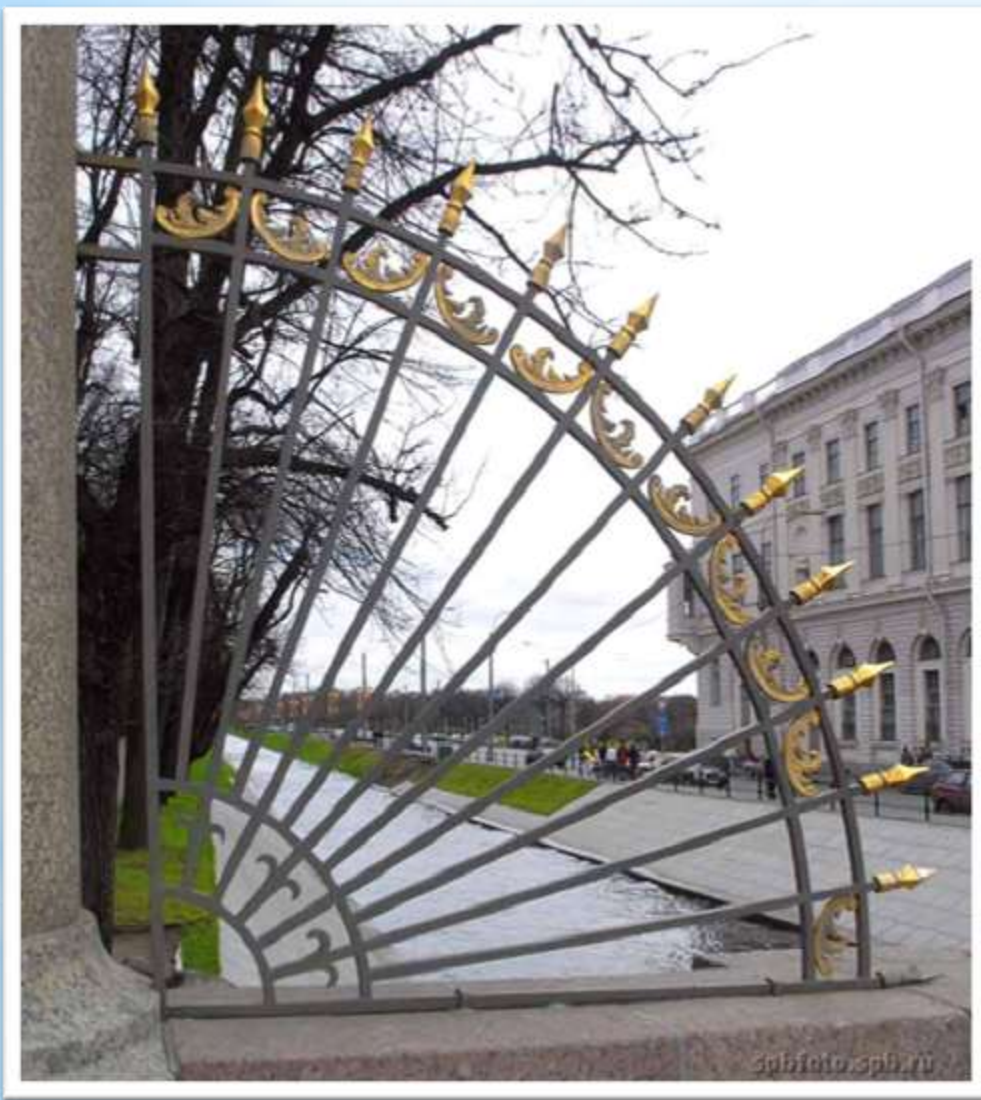
Фрагмент решётки Летнего сада (со стороны Лебяжьей канавки)