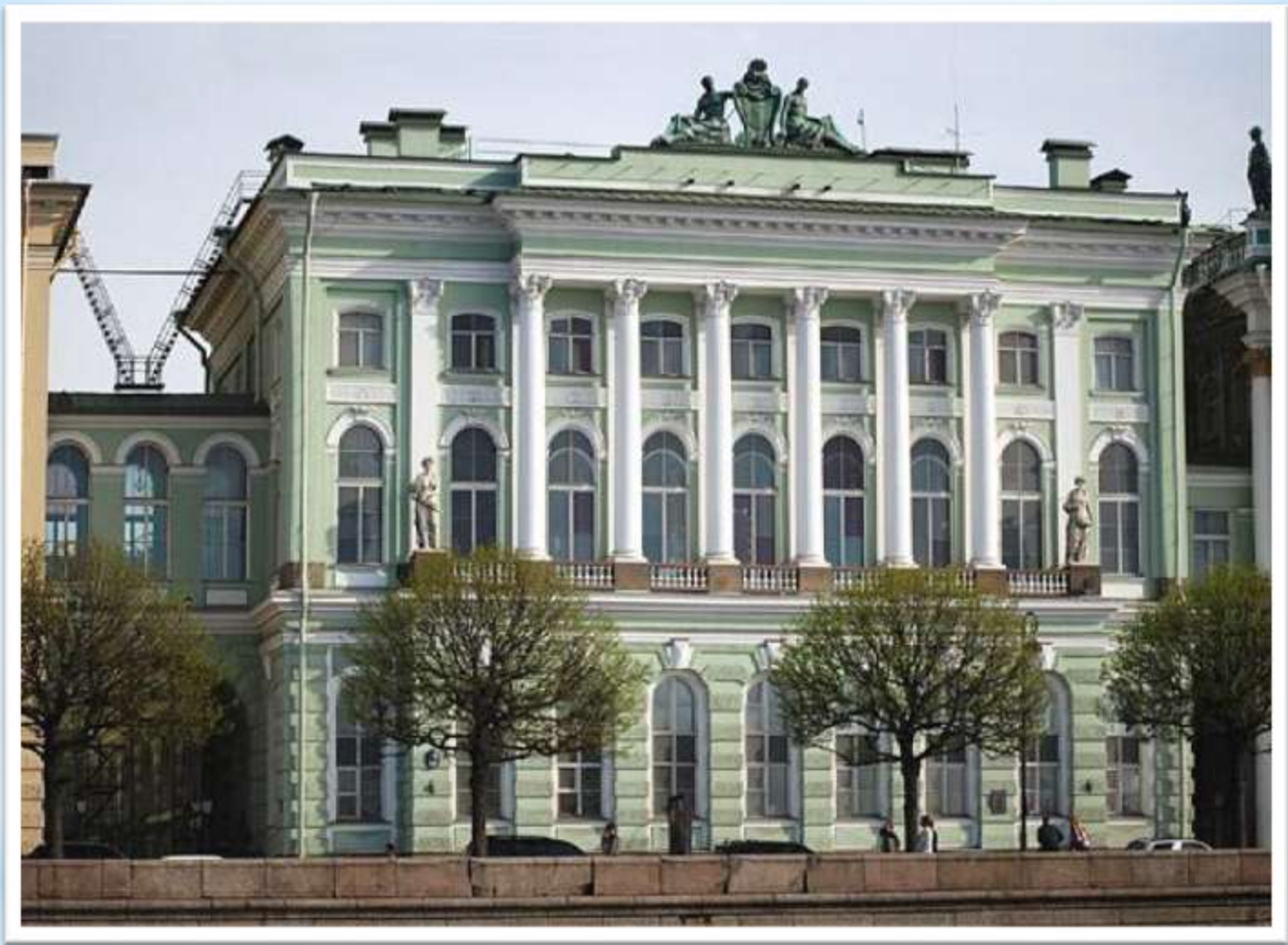
Малый Эрмитаж (Северный фасад со стороны Дворцовой набережной)