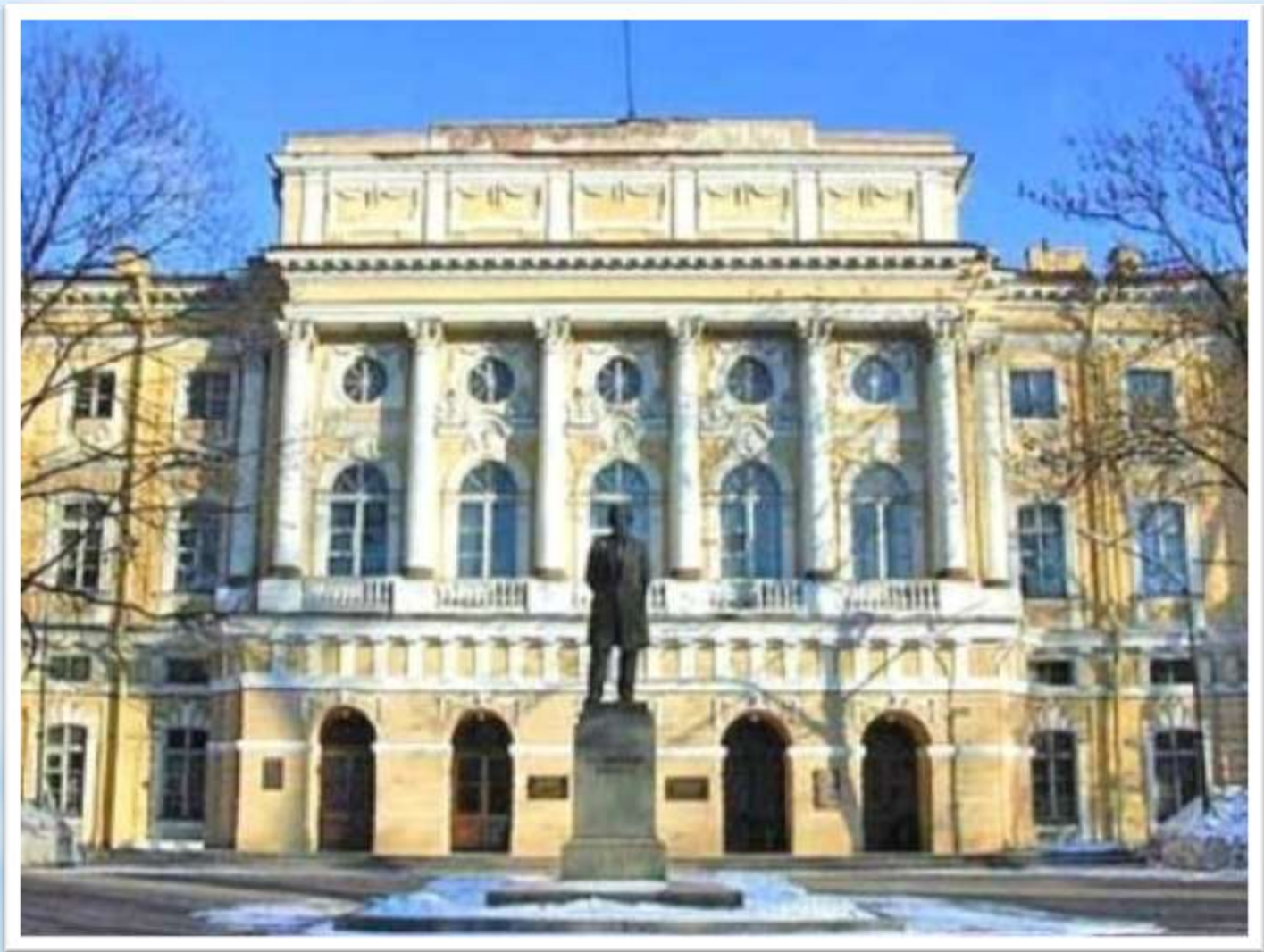
Дворец К.Г. Разумовского (ныне РГПУ им. А.И. Герцена)