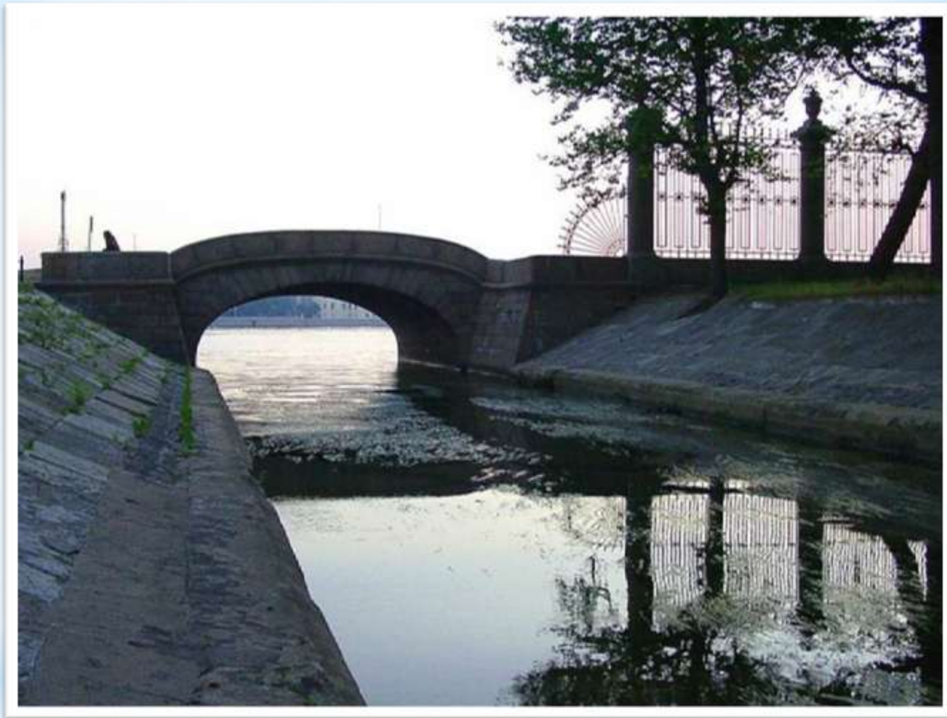
Верхне-Лебяжий мост (через Лебяжий канал по Дворцовой набережной)