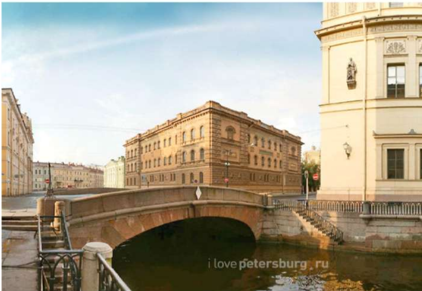
Первый Зимний мост (через Зимнюю канавку на Миллионной улице)