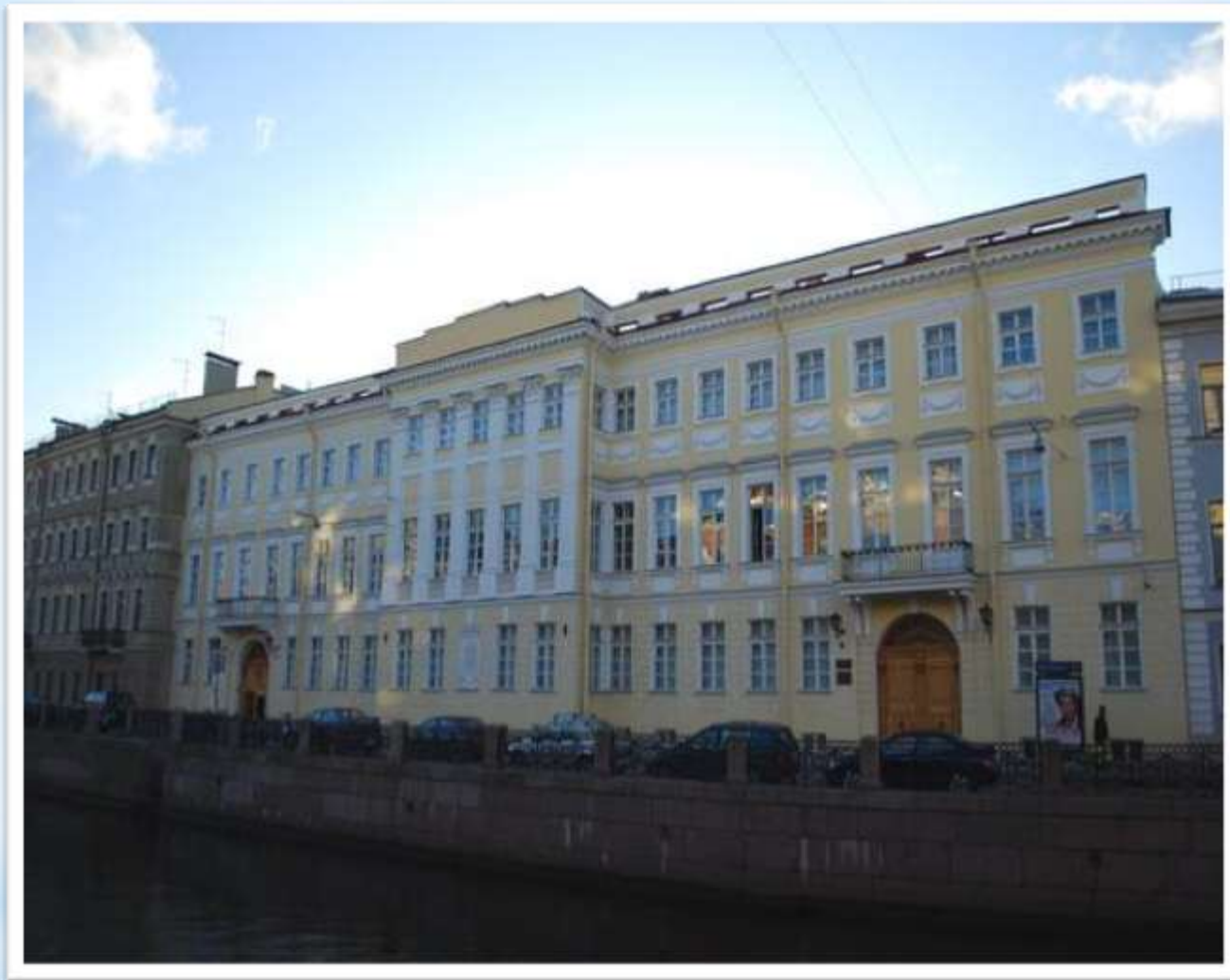
Дом Волконских (наб. Мойки, 12)