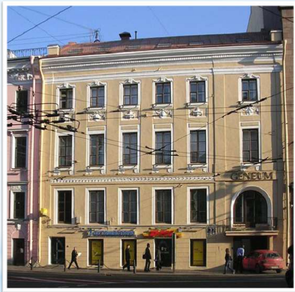
Дом Веймара (Невский пр. 10)